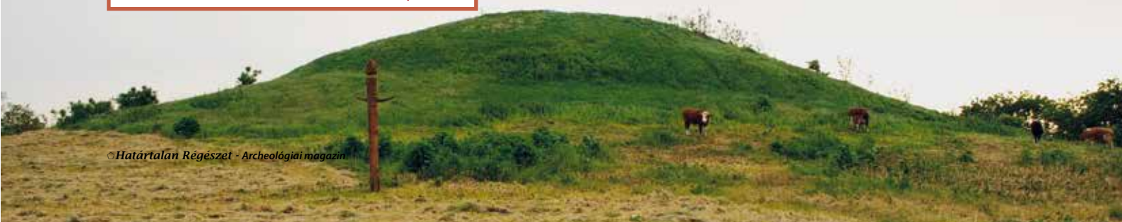
A Békésszentandrás határában álló Gödény-halom