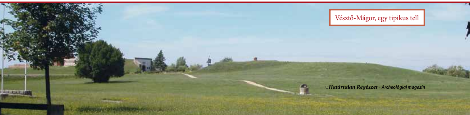
Vésztő-Mágó, egy tipikus tell

Az eddig feltárt halmok alapján megállapítható, hogy a kurgánok mérete és a bennük talált „kincsek” között nincs arányosság, így feltételezhető, hogy az elhunyt rangját nem a mellé temetett értékek mennyiségével, hanem inkább a fölé halmozott föld nagyságával szándékozták jelezni.