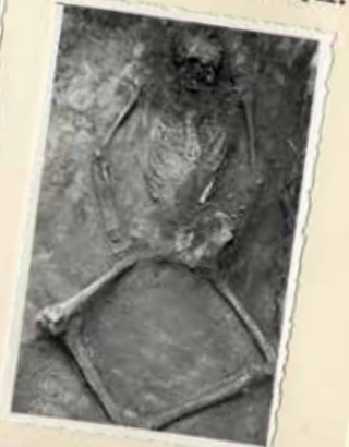
7. Eldőlő csontok és a sovány-lap maradványai.