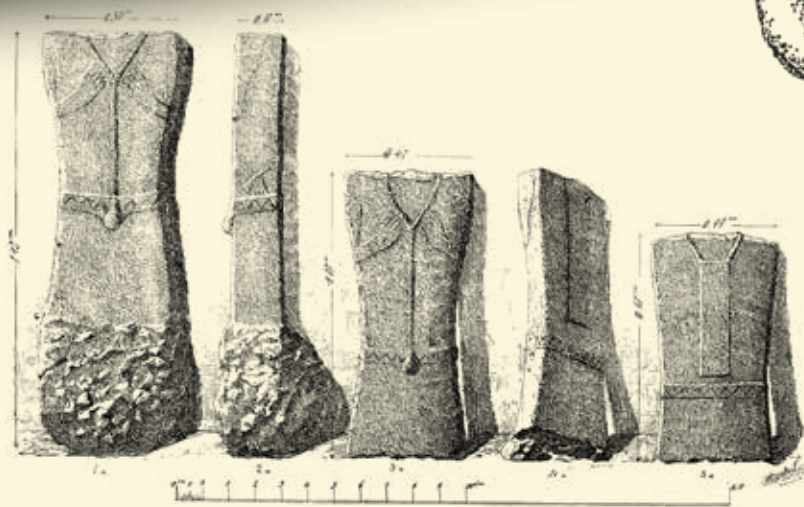
Körösbánya/Baia de Criș-„Borkai forrása”/Fântâna Borchii” (Hunyad megye, Románia) lelőhelyen talált, baltás férfiakat ábrázoló kőstétlék (Téglás I. 1885 alapján)

A Jamnaja-kultúra temetkezési rítusa igen jellegzetes: Ny–K-i irányban tájolt, általában hasított deszkákkal és gyékénnyel fedett gödörsír fölé, a környező terület humuszrétegéből hordott össze a közösség akár 6–8 m magasságot is elérő földhalmot. A gyakran vörös okkerrel befestett fejű, testű, kezű vagy lábú elhunytat általában a hátára fektették, térdben felhúzott, behajlított lábakkal. Fejét gyakran párnaszerű agyag- vagy földpadkára helyezve emelték meg. A sír néha egyszerű, függőleges falú, mély gödör volt, amelyet állati prémmel, bőrökkel, gyékényfonattal vagy akár színes szövött takaróval béleltek. A halottak bizonyosan színes lenvászon és gyapjúruhákat viselhettek. Számos olyan tárgyuk is lehetett (pl. bőrv, fából készített tálak, faragott bot stb.), amelyek szerves anyagból lévén a mi éghajlati és talajviszonyaink mellett nem maradtak fent. Megmaradtak viszont néhány kivételles temetkezésben a nemesfémekből (ezüst, ritkán arany) készült hajfonatot díszítő ékszereik, állati csontból készített ékszerek (főleg Kelet-Európából ismerünk pl. jellegzetes ún. kalapácsfejű tűket, csiszolt, faragott csontkorongokat), és ritkán rézből (nyéllyukas balta, tör) vagy kőből (csiszolt kő fokosok) készített