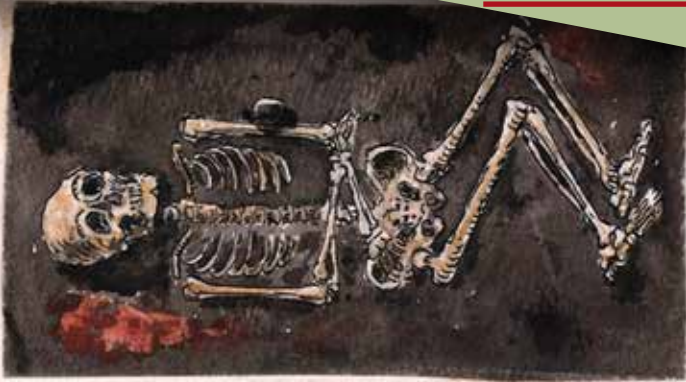
Zoltai Lajos eredeti rajza a Duna-halom feltárásáról (Déri Múzeum Adattára)