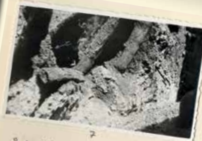
2. A sírkamra csontvázasának fekvése.