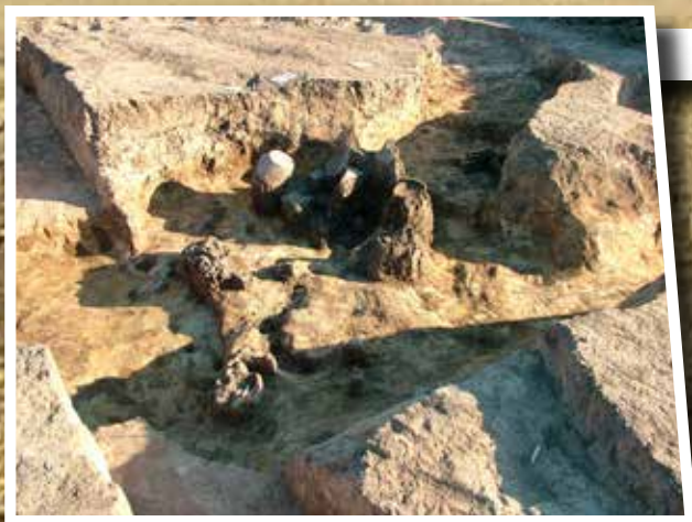
A feltárt sír részletfotója

Ebben az elkülönített térségben zajlott a halottról való megemlékezés kultusza, például a tor. Utóbbi feltételezést támaszthatja alá, hogy a körárkokban néha állati és embercsontokat és törött edényeket is találtak. Lukianosz szkíta főhőse, Toxarisz így beszél a szkíták „jeles napjairól”: „Nemcsak, hogy áldozunk, hanem külön jeles napokon még ünnepekkkel is megtiszteljük őket... úgy hisszük: jót teszünk az élőkkel is, ha megemlékezünk a legjelesebb férfiakról, és tiszteljük a megholtakat. Úgy véljük ugyanis: ekként majd közülünk is sokan kedvet kapnak hozzájuk hasonlóvá lenni.” (Lukianosz: Toxaris, avagy a barátság ) Elképzelhetőnek tartom, hogy a halotti toron vagy e „külön jeles napokon” tartott megemlékezések során kerülhettek a sírt kerítő árokba a kerámia- és állatcsontleletek.