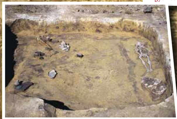
Algyő 100. sír