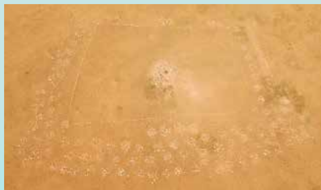
Bronzkori halomsír (kerekszúr) téglalap alakú kőkerítéssel és nagyszámú áldozati kőhalommal. Temeen Csuluu (Teveszikla), Mongólia