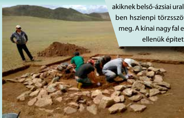
Türk kori kurgán feltárás közben. Galtin Am lelőhely, Mongólia

A z á z s i a i hunokként is ismert hsziung-nuk a Kr. e. 3. században (209-ben) alapítottak birodalmat Mao-tun (Modu) sanjü vezetésével. A kínai Han Birodalommal párhuzamosan fennállt nomád birodalom északi és déli részre szakadt, az északi hsziung-nuk emlékei találhatók meg a mai Mongólia területén, akiknek belső-ázsiai uralmát Kr. u. 155-ben hszienszi törzsszövetség törte meg. A kínai nagy fal egyes részeit ellenük építették.