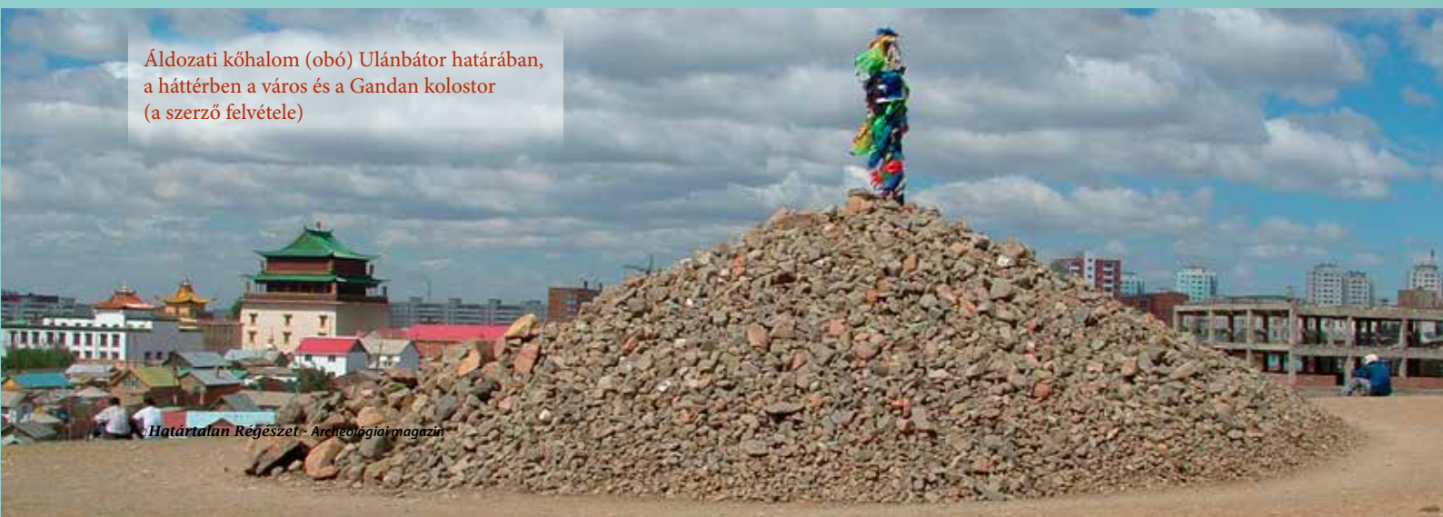
Áldozati kőhalom (obó) Ulánbátor határában, a háttérben a város és a Gandan kolostor

A mongóliai halmokat tehát csak az orosz szakirodalomban nevezik kurgánoknak, a helyiek a khirgiszuur vagy egyszerűen buls (sír) szót használják megjelölésükre. A halom-emelés hosszú és folytonos helyi hagyománya mellett sem bizonyos, hogy minden sírhalom belső-ázsiai nomád eredetű: a türkök és ujugrok elitje a kínai uralkodó család utánzása miatt épített ilyen síremlékeket. Még az sem bizonyos, hogy minden egyes halom sír jelzésére szolgál: a bronzkori kerkszúrok esetében a kisebb áldozóhelyeket is kőhalmokkal jelölték. A mongóliai halmok és egyéb sírépítmények az ország kulturális örökségének, tájképének és hagyományainak nemcsak szerves részei, hanem formálói is. ◊ ◊ ◊