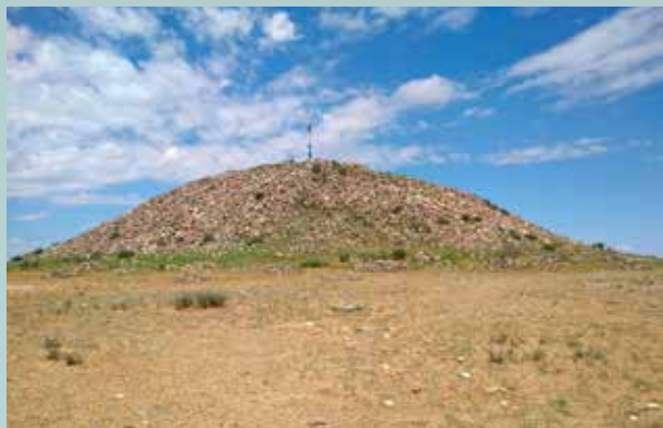
Áldozati kőhalmok (obó) Csintolgoj balgasz kitaj kori erődített települése mellett