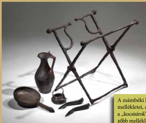
A zsámbéki kocsisír mellékletei, amelyek a „kocsisírok” legjellemzőbb mellékletegyütteseit képviselik, köztük a kézmosó- és fürdőkészletet

A mély és sokszor nagy alapterületű gödrök kiásása után azok aljára először a temetkezési szer- tartás során leölt, felszerszámozott kocsihúzó lovakat helyezték el. Nyakukon vagy mellettük a fogatolásra használt ólomlemezekkel borított, bronzveretes fajármot is megtaláltuk. A lovak tetemére borították az utazókocsikat, amelyeket a gödör méretéhez alkalmazkodva mindig elemeikre bontottak vagy