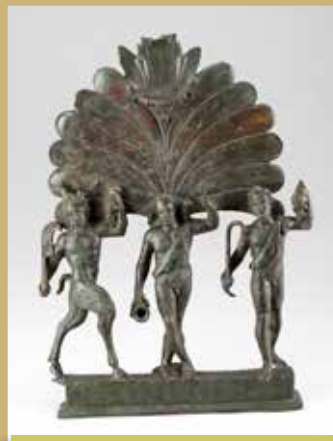
Bacchus és vidám kíséretének szoborcsoportja a szomor-somodorusztai kocsiról

Csak az utóbbi évtizedekben sikerült néhány kocsit tartalmazó római kori sírt régészeti módszerekkel feltárni: 1969-ben Kozármislenyben; 1973–1975-ben Inotán, a 2. halom alatt; 1999-ben Budakeszin; 2003-ban Budapest, a Bécsi úton; 2012-ben Sárísápon és 2017-ben Budapesten, a Csillaghegy lábánál. E régészetileg feltárt sírok segítségével rajzolhatunk pontosabb képet erről a Pannoniában jellemzően a kelta eraviszkusz törzsi elithez köthető temetkezési szokásról.