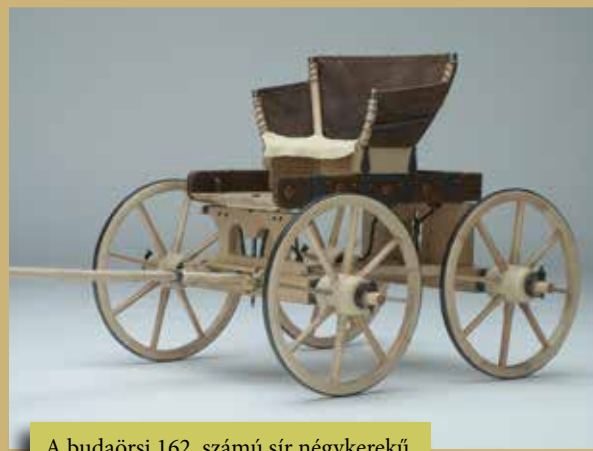
A budaörsi 162. számú sír négykerekű utazókocsijának rekonstrukciója

Több kocsisír esetében azonban a halmommal való borítottság kizárható. A várpalotai halomsírt ezért inkább kivétel, mint általános következtetések levonására alkalmas temetkezésként értékelhetjük. Ezt a sír koraisága magyarázza, hiszen akkorra keltezhető, amikor még nem egységesült a rítus. További szerencsés régészeti megfigyelésekig a halmok és kocsisírok összetartozását ezért csak óvatosan és a bizonyított esetekben fogadhatjuk el.