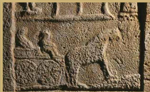
Kocsijelenet a solymári sírsztélén