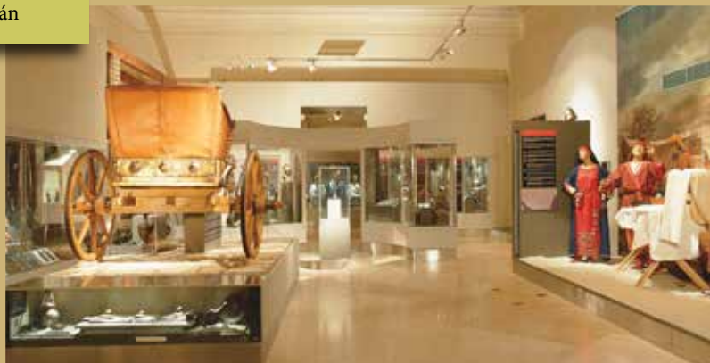
A budakeszi kocsi rekonstrukciója a Magyar Nemzeti Múzeum állandó régészeti kiállításán

Sokáig a halom alá temetett kocsisírok elméletét a Solymáron talált sírsztélé is erősítette, mert kocsijelentét a kép jobb szélén egy kiemelkedés – Soproni Sándor véleménye szerint halomsír – ábrázolása is kiegészítette. Azonban ma már sokkal valószínűbb, hogy ezt a kiemelkedést a közeli Pilis hegyvidéki környezete inspirálta, ahol egykor a temetkező család is élt és közlekedett. Valós vagy fiktív természeti környezet ábrázolása más síremlékeken is előfordul, ahol ugyancsak a képmező jobb szélén lankás domb- vagy meredek hegyoldalakat láthatunk, amelyeken kutyák által üzött nyulak futnak.