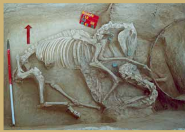
A budaörsi 162. kocsisír alján feltárt fogatos lovak

Magyarország területén az ismert kocsisírok leleteinek többsége a 19. század végén és a 20. század elején, különböző földmunkák során került elő. Szerecsénebb esetekben a leletek adományozás vagy