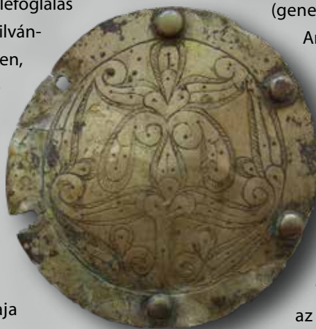
Az Andrejevskaja scseli hajfonatkorong (Anapai Régészeti Múzeum. Fotó: Somfai Kara Dávid, 2016)

(genetika, C14) a Magyarságkutató Intézet Archeogenetikai Kutatóközpontja végzi, az előzetes eredmények alátámasztják az eddigi feltevéseinket. Magyar őstörténeti szempontból a lelőhely jelentőségét jelzi, hogy a területről az elmúlt években több szórványlelet (pl. palmettamintás aranyozott ezüstlemez hajfonatkorong, tarsolylemez-töredék, hasított palmettadíszes övdíszek, szablya) is bekerült az anapai Régészeti Múzeumba. Ezek a leletek a 10. századi Kárpát-medence honfoglaló magyar leletanyagával hozhatók kapcsolatba.