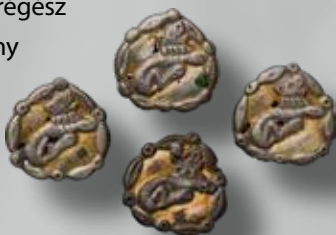
Szórványleletek az Északnyugat-Kaukázusból (Krasznodari Régészeti és Történelmi Múzeum; Mardzsani Gyűjtemény, válogatás)