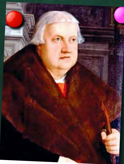
Konrad Peutinger, a Tabula Peutingeriana névadója

A középkori térképek többsége nem volt olyan részletes, mint napjaink nyomtatott vagy digitális térképei. A zarándokok és keresztesek valójában nem térképek alapján tájékozódtak utazásaik során, hanem útvezetőket, kereskedőket követtek. Az emberek többsége olvasni sem tudott, a középkori térképek latin feliratait pedig nem értették. A térképek valójában a kolostori könyvtárak kincsei közé tartoztak, és mindössze néhány szerzetes láthatta őket.