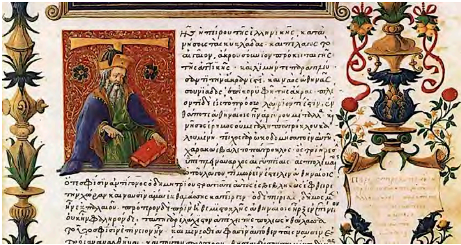
Egy oldal Pausziasz egyik középkori kéziratából

Egy liget fölötti hegyen állt maga a jóshely, és tulajdonképpen ott áll a mai napig. Fehér márványtalapzat veszi körül, kerítéssel, amely eredetileg közel két könyök magas volt. A talapzataból hegyes