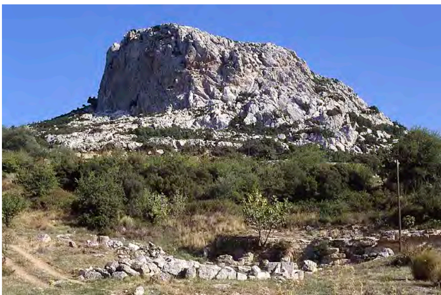
Apollón Ptóiosz szentélyének maradványai

Pindarosz, a Kr. e. 5. század neves költője a boiótiai Thébaiban született és élt. Egy későbbi boiótiai szerző, Plutarkhosz beszéli el Pindaroszról, hogy egyszer egy jósdához fordult és feltette a kérdést, mi a legdrágább kincs az ember számára. A papnő azt felelte, nem érti, miért kérdezi ezt éppen az a költő, aki megírta Agamédész és Trophóniosz történetét. De azt is hozzáfűzte, hogy nem sok idő múltán úgyis meg fogja tudni kérdésére a választ. Pindarosz ezt úgy értelmezte, hogy a jóslat szerint hamarosan meg kell halnia.