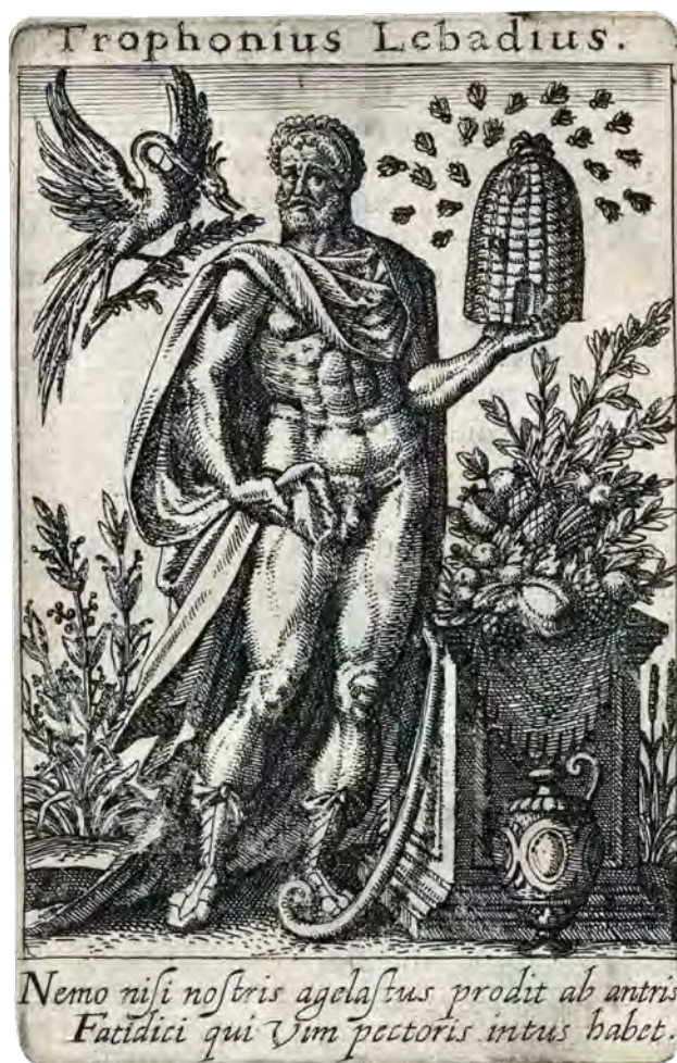
Trophóniosz és a méhek egy 1675-ös metszeten

Jelentős állatáldozatokat is be kellett mutatnia, mivel sok húsrá volt szüksége. Így áldoznia kellett Trophóniosznak, a fiainak, Apollónnak, Kronosznak, Zeusz Baszileusznak, Hérának és Déméternek. Az utóbbi istennőről azt mesélték, hogy Trophóniosz dajkája volt egykor. Az áldozatokat minden esetben egy jóspap felügyelte, aki megvizsgálta az állatok belső részeit, és azok alapján jelentette ki, hogy Trophóniosz jóindulattal fogadja-e majd a jóslatkérőt. Az áldozatkérés napján egy kost áldoztak fel egy gödörben. Ha ennek az állatnak a belső részei-