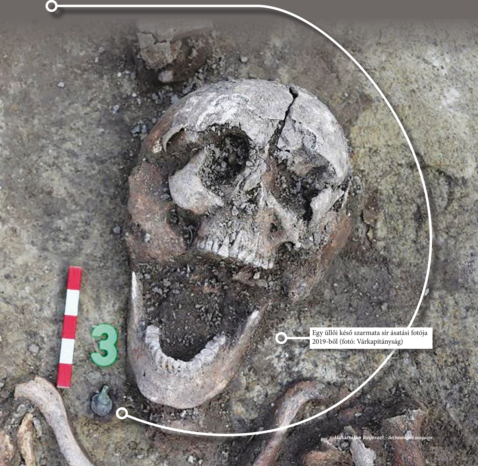
Egy üllői késő szarmata sír ásatási fotója 2019-ből