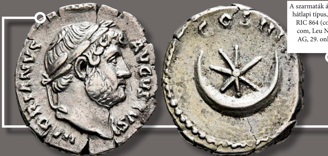
A szarmaták által kedvelt hátlapi típus, Hadrianus RIC 864

a hold és csillag motívumokat felhasználva saját kompozíciókat is alkotnak, noha épp a csillagos-holdas hátlapi típusok római előzményekre mennek vissza. Hadrianus császárnak is voltak például ilyen veretei, ezeket gyakran fülelve (Üllő-Juhállás) vagy lyukasztva (Ecser 7.) késő szarmata sírokban találjuk meg. A rómaiak a csillagokhoz általánosságban az örökkévalóságot, latinul æternitast társították.