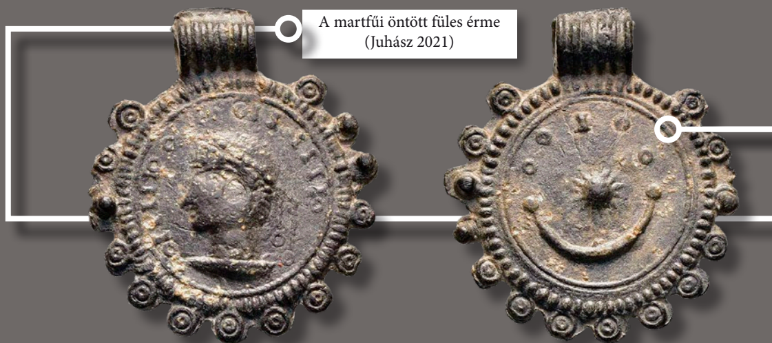
A martfűi öntött fűles érme (Juhász 2021)

A szarmata éremutánzatok zömmel a 3–4. századi római érmeiket másolják, különös tekintettel a tetrarchia és a Constantinus-dinasztia érmeire. Leginkább rézötvetekből készülnek, és gyakran lyukaszással teszik őket viselésre alkalmassá, de sokszor már eleve egy fűles lapkára verik őket. Vannak olyan érmeik ezek között, melyek minőségüket tekintve közelebb állnak a másolt római pénzekhez, de számos esetben már roppant stilizálttá vált az eredeti ábrázolás, az érmeik köriratai például 'I' és 'O' betűkké egyszerűsödnek.