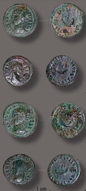
A békésszentandrási női sír érméi (Juhász 2020)