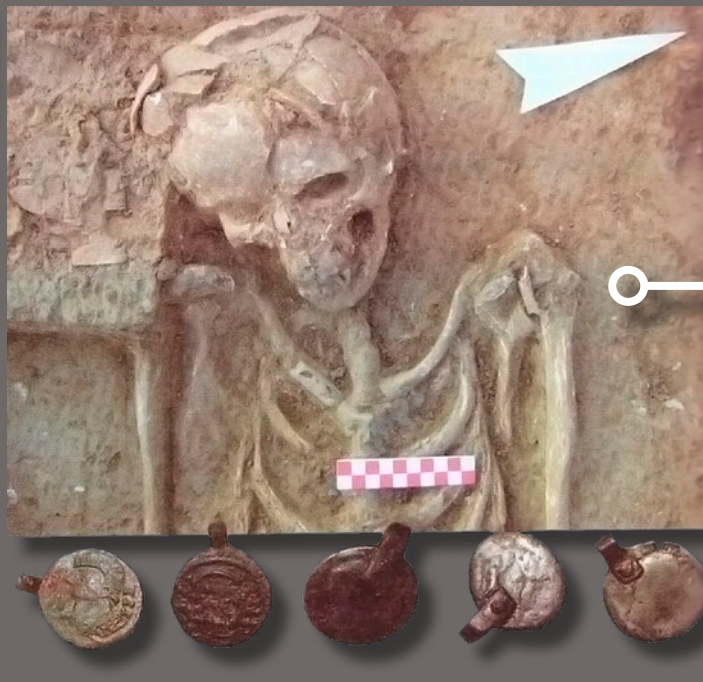
A marteni sír 5 érméje (Varbanov–Dragoev– Rusev 2019)

A Barbaricum a Római Birodalommal szomszédos területek megnevezése, ahol a rómaiak által barbároknak tartott népek, mint a kelták, a germánok, vagy a szarmaták éltek. Ezen területek élénk kapcsolatot tartottak fenn a birodalommal, stabil időszakokban élénk kereskedelmet folytattak, zavaros időkben pedig betörték a szomszédos provinciákba.