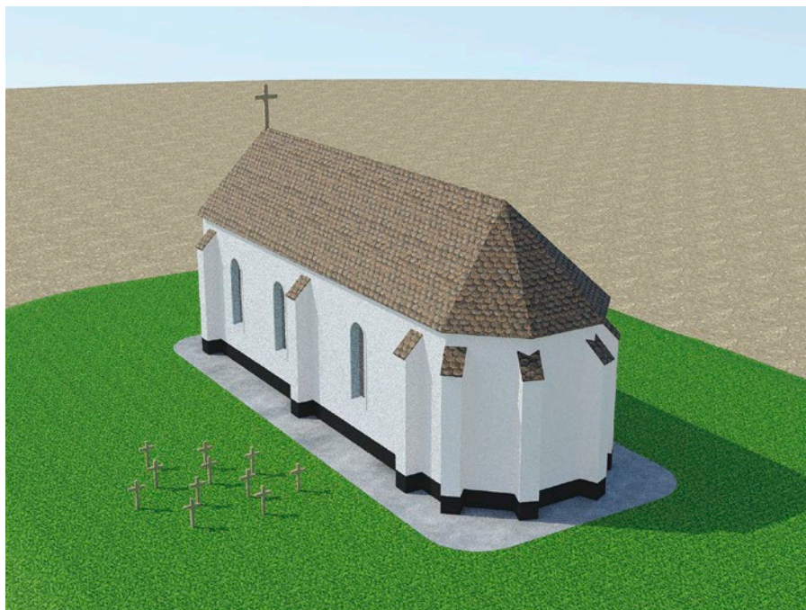
A templom legutolsó fázisának fantáziarajza (készítette: Gerencsér Ádám, Savaria Múzeum)

ján). Kijelenthető az is, hogy a templom több építési fázison is áteshetett. Méretei is nagyban változhattak az idők során, mivel a közel 21 méteres hosszúság nem éppen egy Árpád-kori kistemplomra utal. Biztosabb periodizációt azonban csak egy jövőbeli régészeti feltárás segítségével lehetne megállapítani. Az általunk gyűjtött felszíni leletek alapján az intenzívebb jelenlét és használat nyomait a 14. század második felétől lehet kimutatni a területen.