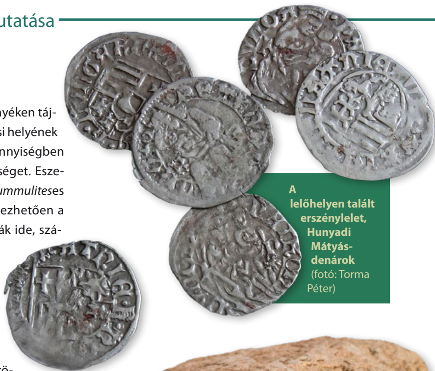
A lelőhelyen talált erszénylelet, Hunyadi Mátyás-denárok

A kutatásunk során megfogható alaprajz, a párhuzamok és a templomról ránk maradó leírások, továbbá térképábrázolások és helyi idős emberek elbeszélései segítségével megkíséreltük rekonstruálni is a templomot. A templom 1851-es térképi ábrázolása ugyanis egybevág a helyi idős emberek elmondásával: a „szőlőhegyre néző [azaz a nyugati] vége tűzfalás”, a „fal felé néző vége [azaz a szentély] pedig farazott”. Az 1750. évben történt felújítási munkálatok kapcsán azt is megemlítik, hogy a templomhoz fából egy tornyot emeltek, továbbá a tetőt faszindellyel fedték le. Elképzelhető az is, hogy az említett fatorony egy különálló harangláb lehetett. Az említett 1851-es térképábrázoláson a templom déli falán 3 ablakot is jeleztek. Amennyiben teljesen hiteles a rajz, akkor kijelenthető, hogy az épület bejárata a nyugati oldalon lehetett annak végső építési fázisában.