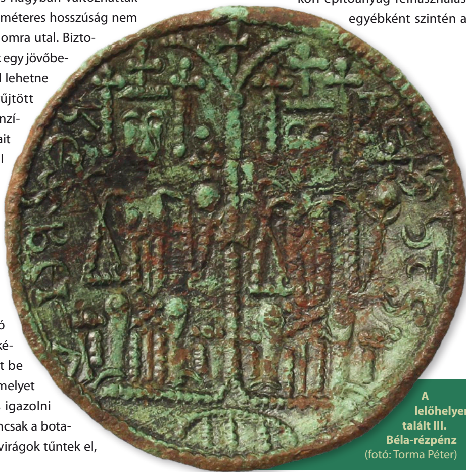
A lelőhelyen talált III. Béla-rézpénz

Az így felszínre került alapozásdarabok azonban segítséget is nyújtanak a felhasznált építőanyagok meghatározásához. Eszerint az egykori templom alapozását téglából, zöld márgából, római kori tetőcserep- és téglatöredékekből és mészkőből készítették. A római kori építőanyag felhasználása egyébként szintén az