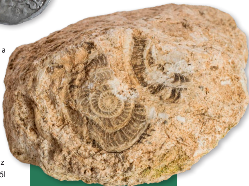
Látványos, Assilina spira fajhoz tartozó ősmaradványok a templomhelyen talált mészkőben

A fent leírtak alapján is egyértelmű, hogy a roncsosmentes vizsgálati módszerek régészeti alkalmazása és a régészetet segítő társtudományok együttes használata révén nagyon sok közelítő információt gyűjthetünk össze egy-egy lelőhelyről. A levéltári adatok, a terepi munka és térképábrázolások ebben az esetben is rengeteg információt szolgáltatnak számunkra, noha számos kérdés még nyitott a nagytilaji pusztatemplom kapcsán. Ezek megválaszolását elsősorban a lelőhely talajradarral történő alapos felmérése és az azt követően kijelölhető ásatási szelvények megnyitása segítené elő.