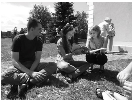
A Csöngé-monográfia bemutatója előtt (2011)

falucskára, és az ott eltöltött napokra: „Egyfelől azért jó Csöngén lenni, mert örömteli együtt gondolkodni az irodalomról olyan emberekkel, akik érdeklődők, kíváncsiak egymás véleményére, és hajlandóak ezeket a véleményeket vitára bocsátani. Minden vitának van ugyanakkor egy közös nevezője: az irodalom mérhetetlen szeretete. Másfelől persze azért jó Csöngén lenni, mert az irodalom kitűnő ürügy arra, hogy néhány ember, néhány napig jól érezze magát egy szép