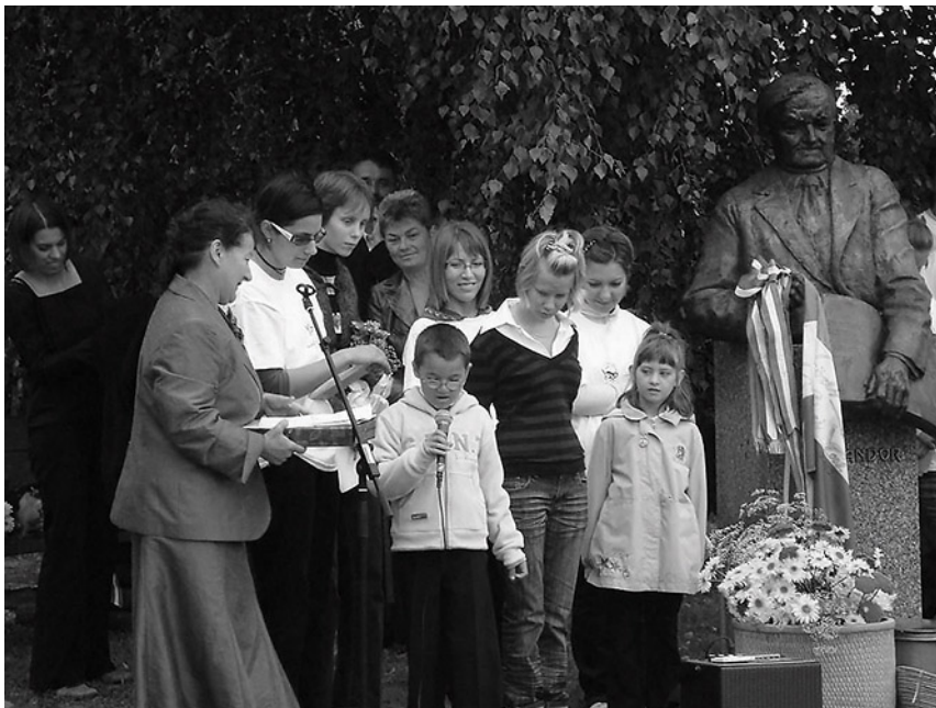
Együtt ünnepel a falu apraja-nagyja és az olvasótáborozók