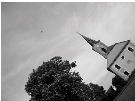
Csőnge ilyen nekünk (2009)

Egy könyvnyi hely – vagy akár több órányi hangfelvétel – is kevés lenne akkor, ha minden odalátogató szeretné elmesélni, hogy mit jelent, mit adott neki ez a Vas megye szívében megbúvó apró település, amely oly szerényen nyújtózkodik a kemenesalji dombok árnyékában, Ostffyasszonyfa és Kenyeri között. Barátságos lakói, békés utcácskái megannyi természeti és történelmi emléket őriznek, szépen csengő neve olyan, mintha Weöres Sándor találta volna ki, hogy így nevezze el egyik képzeletbeli országát: Csönge.