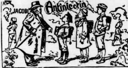
Csakis a Jacobi jelzéssel valódi

„Mi-i-t? — Papa megengette! Hisz, valódi JACOBI-féle Antinicotin-cigaretta hüvelyek fadobozban!