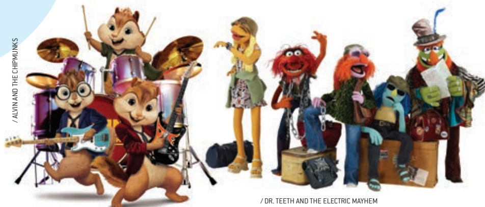
/ ALVIN AND THE CHIPMUNKS