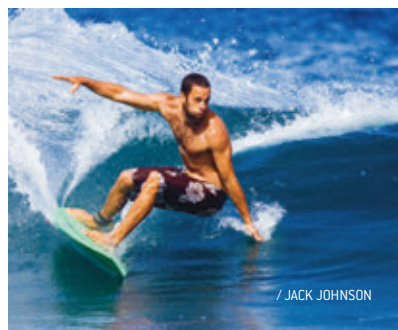
/ JACK JOHNSON

A keresztény rockzenekar kilencedik, Fading West című albumával egyidőben megjelent egy azonos című kísérőfilm is, aminek fókuszában a tagok szörf iránti rajongása áll. Ráadásul 2005 óta minden évben megrendezik a Bro-Am nevű adománygyűjtő fesztivált/tábort is, aminek a hullámlovaglás szintén esszenciális része.