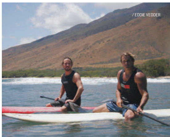
/ EDDIE VEDDER