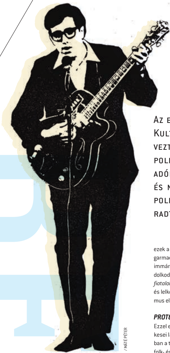
/ MATE PÉTER