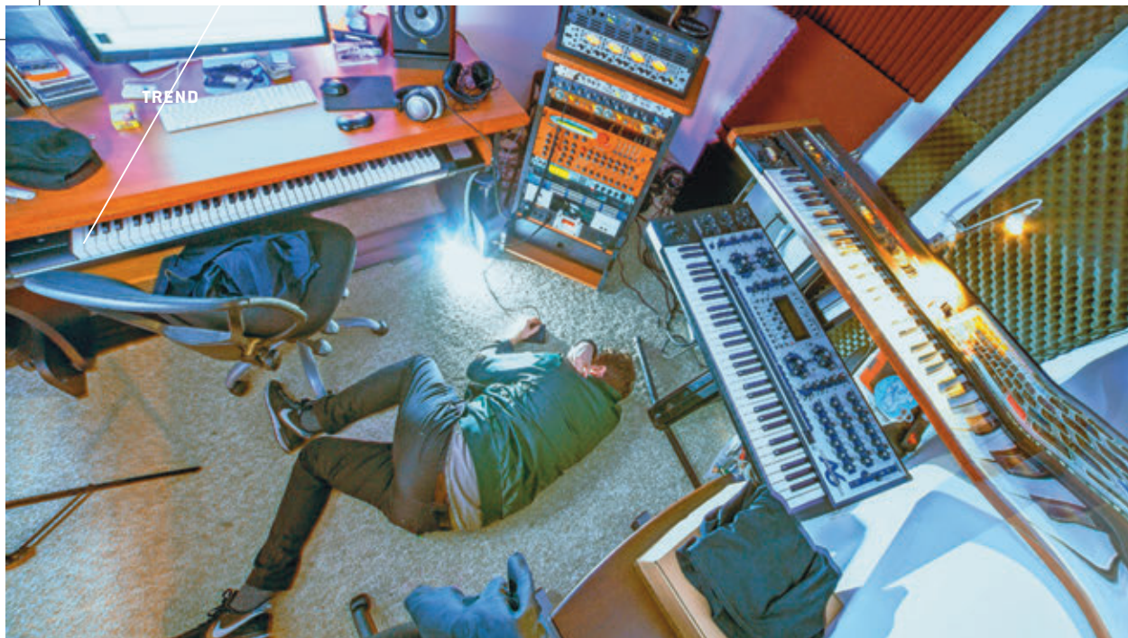
/ ONEIDRHX POINT NEVER