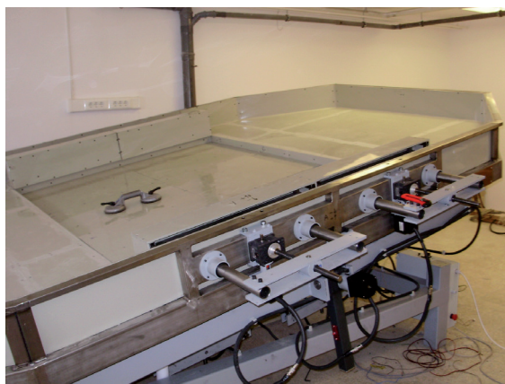
1. ábra. A modelltér feltöltés előtti állapotában, a villanymotorok és a dönthetőség a felső határon

A folyamatok időbeli változásnak követésére két megközelítést alkalmazunk. Egyrészt detektáljuk a kísérlet összes képi információját, valamint a modell térben lejátszódó folyamatok fizikai paramétereit. A kísérlet lefolyását 8 db overhead CANON 1110 D fényképezőgép dokumentálja. A gépek egy konzolrendszeren helyezkednek el (2. ábra), egymástól változtatható távolságban, alapbeállításban 30 cm-es térközben és 1,2 m-es magasságban. A képek közötti átfedés 18-as gyújtótávolságnál megközelítőleg 80%, ami lehetővé teszi a 3D-s képalkotást, illetve terepmodell elkészítését. A fényképezőgépek USB összeköttetésen keresztül, saját fejlesztésű (CANON SDK alapú) szoftverrel vezéreltek.