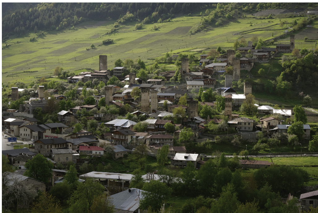
6. ábra. Mesztia különleges lakótornyaival

átszelő Enguri völgyét követve egy egykori gleccservölgyben jelentős morénalerakódással és hosszú időn keresztül megmaradó hófoltokkal találkozhatunk. A völgy végén megpillantottuk Grúzia legmagasabb csúcsát, az 5201 méter magas Skharát.