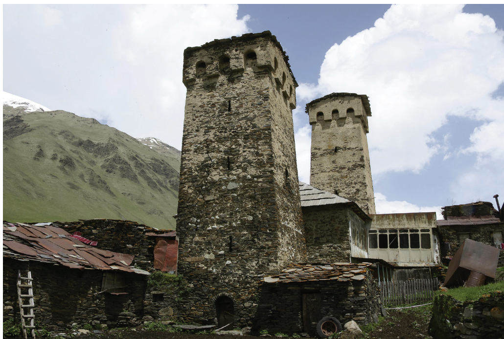
7. ábra. Usguli középkori hangulatot árasztó települése

lakosságának köszönhetően az első világháború végéig jelentős kulturális és kereskedelmi kapcsolat maradt Oroszország és Nyugat-Európa, valamint a Közel-Kelet között.