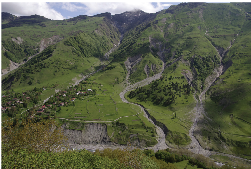
10. ábra. Eróziós árkokkal, völgyekkel tagolt völgyoldal (fotó: Karancsi Z.)

Visszatérve a fővárosba a következő utunk Kelet-Grúziába, Kahétiába vezetett. Ezt a festői tájat joggal nevezik Grúzia gyöngyének. Éghajlati és talajviszonyai miatt mezőgazdasági, elsősorban szőlőtermő-bortermelő vidék. A szőlőskertek legnagyobb része az Alaszani folyó völgyében található. A tudósok szerint Grúzia a szőlő egyik őshazája, régészeti kutatások bebizonyították, hogy a szőlőtermesztést, borászatot már Kr.e. 5–4. évezredben is ismerték itt. Jelenleg 400 szőlőfajtát tartanak számon Grúziában, s a legjobbak éppen itt az Alaszani völgyében teremnek. Szinte nem volt olyan ásatás, ahol ne találtak volna földbe ásott hatalmas bortároló edényeket (kvevriket). A korai szőlőtermesztést, borászatot nyelvészeti kutatások is megerősítik, ugyanis a bor grúz elnevezése (gvino) rokon a latin vinummal. Az ezeréves grúz templomok gyakori díszítő motívuma a szőlőlevél és a szőlőfürt, de a grúz abc betűi is a tekergős szőlőszárat és kacsokat utánozzák. A térség központja Szignahi városa, ahonnan feltáruul előttünk az Alaszani völgye, azon túl pedig a távolban a Nagy-Kaukázus hófedte bércei. A várost a szerelem városának is nevezik, mert állítólag hangulatos macskaköves utcáin sokan esnek szerelembe. Itt találjuk Grúzia egyik legfontosabb zarándokhelyét, a Bodbei-kolostort, ahol Szent Nino sírja található.