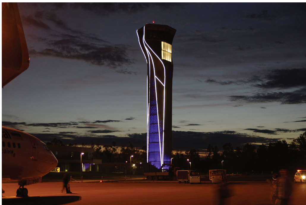
4. ábra. A Kutaiszi repülőtér modern irányítótornya

folyamatosan épülnek a tengerparti hatalmas szállodakomplexumok és apartmanházak, ami az ingatlanpiac megélénküléséhez vezet. Korunk sztárépítészei lehetőséget kaptak álmaik megvalósításához (5. ábra), nagyon szép parkok, modern szobrok is helyet kaptak a városban. Az egyik – modern, mozgó – fémszobrot a szerelem ihletette. Ali és Nino – a grúz Rómeó és Júlia – varázslatos szerelmi története egy megtörtént tragikus esetet elevenít fel. Ali, egy azeri muzulmán arisztokrata család sarja az első világháború idején beleszeretett a szépséges grúz keresztény hercegnőbe. A társadalmi és kulturális ellentétek miatt mégsem lehettek egymáséi, végül Ali a háború áldozatává vált.