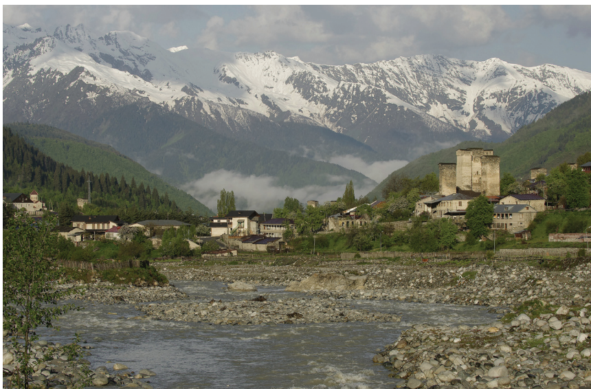
1. ábra. A hegyekkel keretezett Mesztia városa

Valóban, nem sok olyan szép és természeti értékekben gazdag vidék van a világon, mint Grúzia (1. ábra). A hazánknál kisebb, majdnem kerekén 70 000 km 2 területű ország rendkívül változatos domborzatú, hiszen feltöltött alföldekkel, zárt medencékkel és állandó hóval fedett magashegységekkel egyaránt találkozhatunk itt. Ennek megfelelően éghajlata is igen változatos: nyugaton szubtrópusi, keleten száraz kontinentális, északon a magassággal változó éghajlat jellemző.