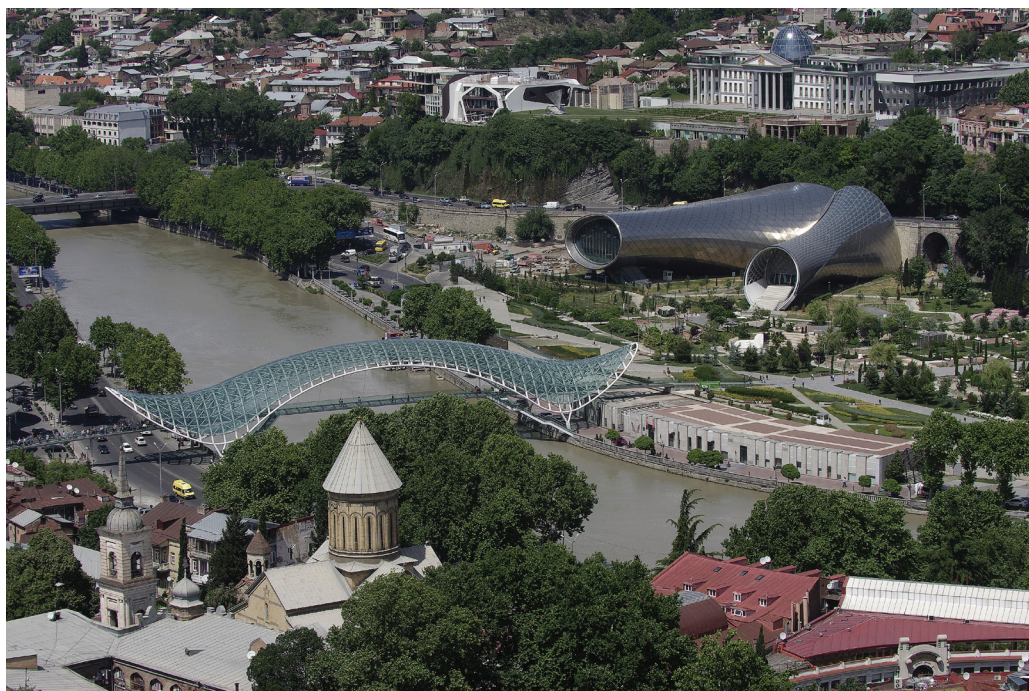
8. ábra. Tbiliszi látképe

hadiútról a Kr.e. 1. században már Sztrabón görög földrajztudós is megjegyzi Ibériáról szóló útirajzában, hogy az út nehéz és veszélyes. Valójában akkor lett hadiút, amikor a 19. században az orosz katonák észak felől kiépítették. 1861-ben fejezték be, ezután kerültek orosz fennhatóság alá a Kaukázustól délre eső területek. A hadiút elnevezés sem véletlen, hiszen ez nem annyira kereskedelmi út, mint inkább mindig is a hadak vonulásának útvonala volt. A vad sztyeppe nomádok itt törtek be, hogy megrenessék a grúz keresztény civilizációt. A valódi kereskedőkaravánok a meredek, omlásveszélyes és különféle bandák által uralt grúz hadiút helyett inkább a biztonságosabb Kaszpi-tenger melletti parti utat választották.