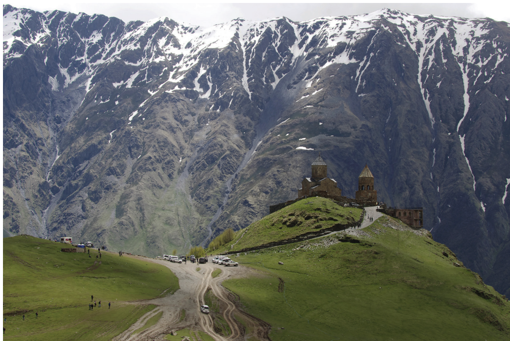
11. ábra. A 2170 méter magasan lévő Gergeti Szentháromság kolostor

Utolsó megállónk Grúzia legrégebbi városa, a Kura folyó sziklás partjába vájt Upliszihe barlangváros volt, amelynek első barlangépületei a Kr. e. 2. évezredben készültek. A település nevének jelentése: „az Úr erődítménye”. A település fénykorát a Kr. e. 6. század és a Kr. sz. 1. század közé teszik, amikor is 20 000 ember lakott itt. Volt királyi székhely és a Selyemút részeként fontos kereskedelmi központ is. A 12. században vesztett fontosságából, majd a következő században, miután a mongolok kifosztották, véglegesen elvesztette jelentőségét, végül az 1920-as földrengés a város nagy részét elpusztította. A település feltárását csak az 1960-as években kezdték el.