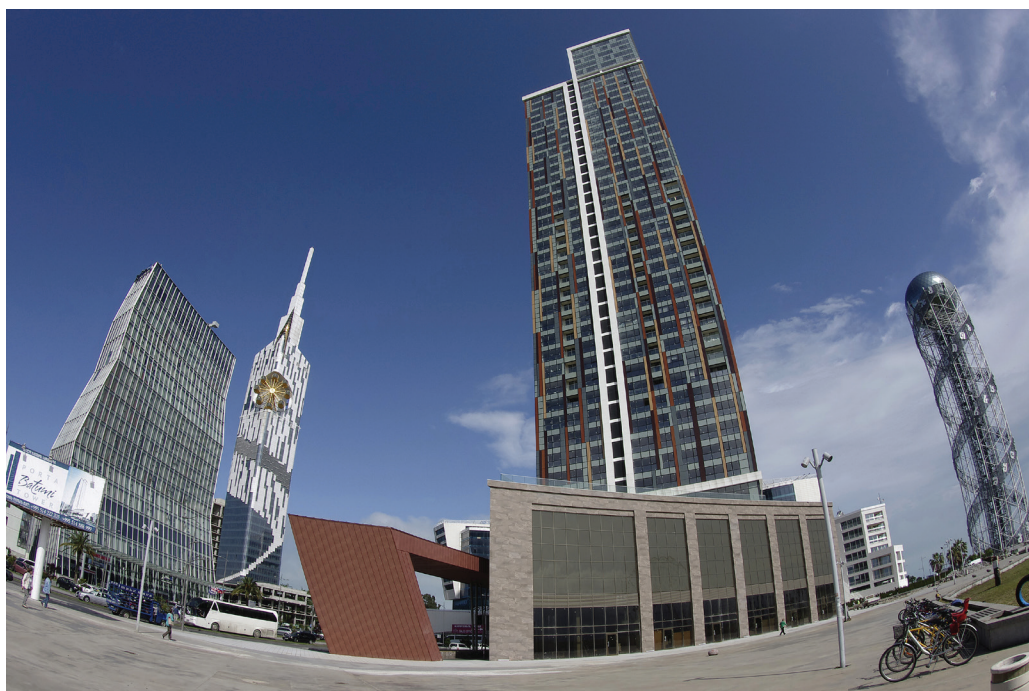
5. ábra. Batumi modern tengerparti központja irodaházakkal

kialakított vizes élőhelyek védelmére jött létre (Ramsari terület). Elérve az Enguri folyót megcsodáltuk a már 1961-ben elkezdett, de csak 1987-ben átadott, 4 millió köbméter beton beépítésével elkészített Enguri-duzzasztógátat, amelynek impozáns méretei (szélessége 750 méter, magassága 271,5 méter) lenyűgözik a látogatókat. Jelenleg az ország áramtermelésének közel felét szolgáltatják turbinái. A létesítmény érdekessége, hogy míg a duzzasztógát grúz, addig az áramtermelő egységek a szakadár abház területen találhatóak. Az Enguri a Magas-Kaukázusban ered a Skhara-gleccser olvadékvizeként. A gleccserpatakok kőzetliszttől zavaros, szürkés színű vizét gleccsertejnek nevezik.