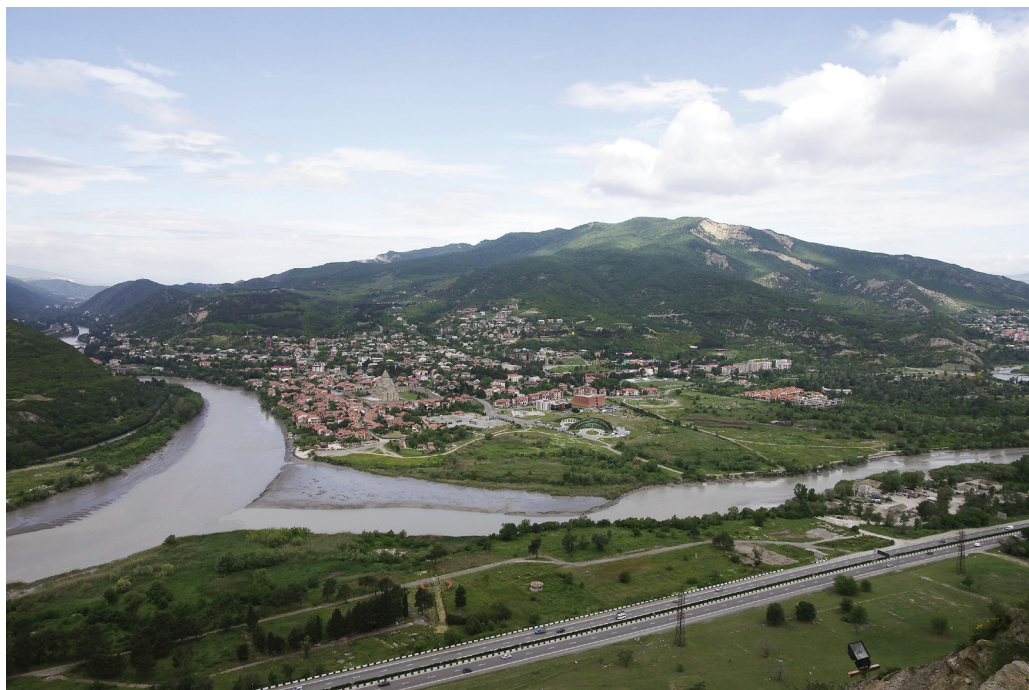
9. ábra. Mcheta, az ősi főváros a Kura és az Aragvi folyók összefolyásánál

Bár az ókorban Mcheta a térség egyik legnagyobb városa volt, mára egy csendes múzeumvárossá vált, amelynek legfőbb látnivalója ősi temploma, a Szvetichoveli-székesegyház. Ez a grúz ortodox egyház központja, az ország második legnagyobb egyházi épülete. A székesegyház helyén épült Grúzia első temploma. Neve (Szvetichoveli = teremtő pillér) a legendák szerint onnan származik, hogy amikor az első keresztény király elhatározta egy templom építését a palota kertjébe, a mesterek sehogy sem bírták megmozdítani azt a hatalmas gerendát, amit fő tartópillérnek szántak. Ekkor Szent Nino egész éjszaka imádkozott, aminek hatására a mennyből segítséget kapott, és reggelre mindenki nagy meglepetésére állt a hatalmas gerenda. A Székesegyház és a Szent Kereszt-kolostor 1994 óta kulturális világörökség.