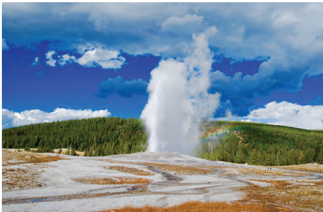
1. kép. Gejzír kitörése a Yellowstone Nemzeti Parkban

A földtudományi természeti értékek védelmére és bemutatására sokfajta intézménysített területtípus létezik a Föld egyes országaiban, amelyek persze – nevezéktanukon túl