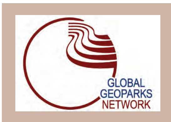
4. ábra. Az UNESCO Globális geopark Hálózat logója

megadott szempontrendszer alapján pályázati anyagot kell összeállítani. Mivel értelemszerűen nem minden pályázó nyerheti el a címet, csak kb. évi 10-12, ezért több országban létrehoztak az említett hálózatoktól független, különösen a belföldi geoturizmust fellendítő ún. nemzeti geoparkokat is. Magyarországon jelenleg folyik az a törvényalkotási folyamat, amely lehetővé teszi majd nemzeti geoparkok létrehozását, természetesen az UNESCO-geopark cím elnyeréséhez szükségeshez hasonlóan szigorú feltételek teljesülése esetén. Erről majd a Magyar Geopark Bizottság dönt, mint ahogy arról is, adott esetben továbbítja-e egy UNESCO-geopark várományos pályázatát a nemzetközi szervezet illetékes bizottságához.