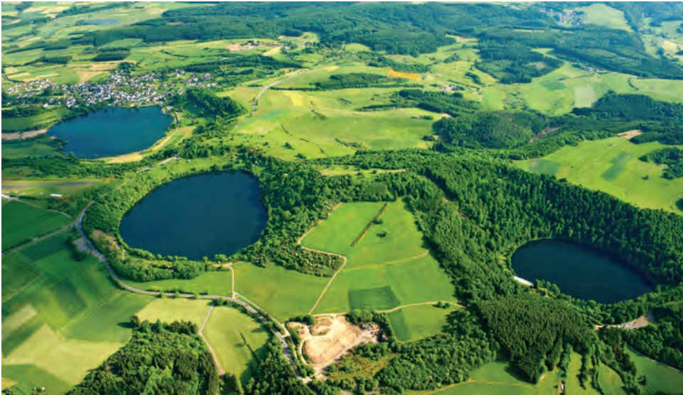
2. ábra. Maarak a Vulkaneifel Geoparkban (forrás: https://www.eifel.info/natur/unesco-geopark-vulkaneifel/ )