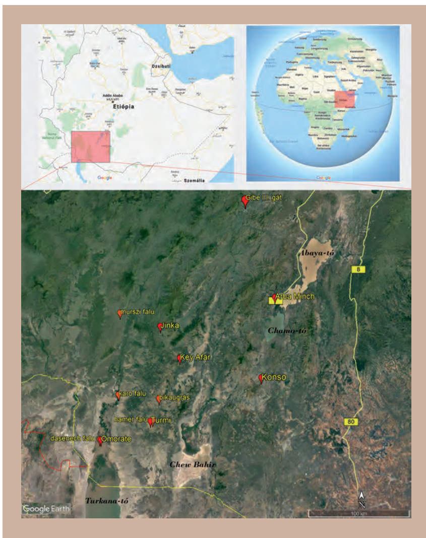
1. ábra. A terület térképvázlata (Google Map és Google Earth alapján)

hogy hosszú ideig raktározható legyen és a rovarok se egyék meg. A legtöbb törzsnél a felnőttek cirokkását esznek, hús csak nagyon ritkán kerül az „asztalra”. Csak a fiatalok esznek húst, illetve betegség esetén vagy ünnepekkor vágnak kecskét. Ha a marhahús nem is, a vér és a tej fontos fehérjeforrás az egyhangú növényi táplálék mellett. Főleg a fiatalok fogyasztják, fejlődő szervezetük szükségletei miatt, mégpedig úgy, hogy megcsapolják a marhák nyaki erét és a vért tejjel keverik össze. Kiegészítő táplálékuk a méz.