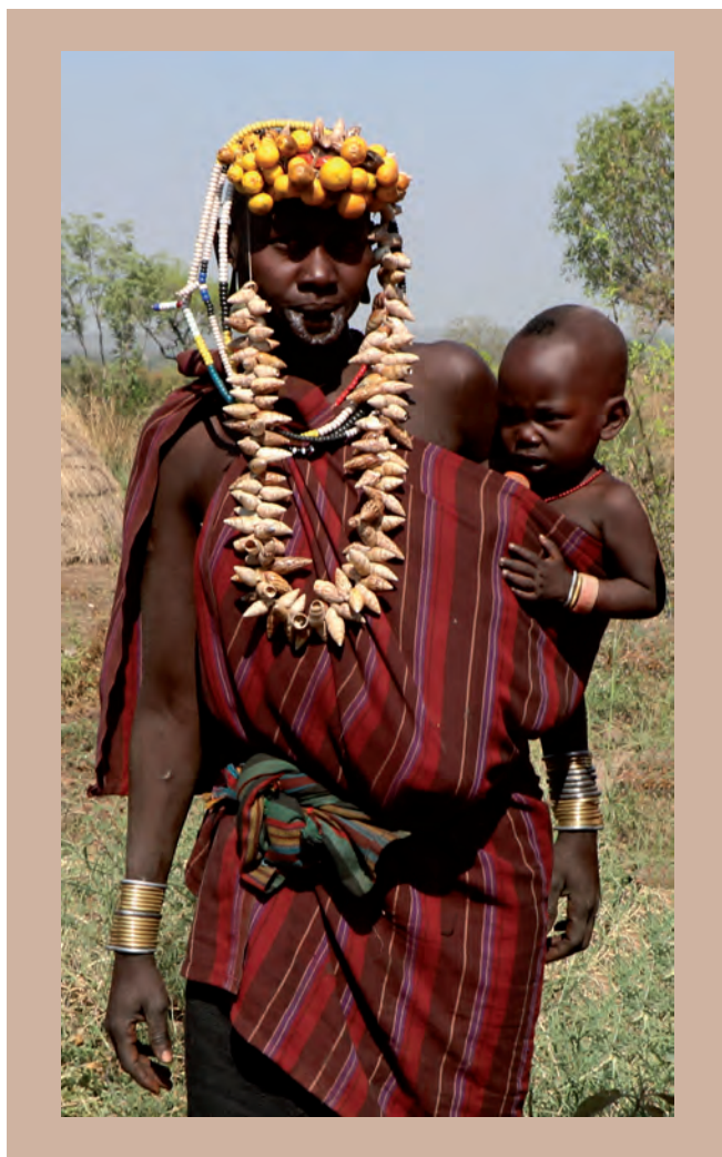
9. ábra. A murszi nők nem hordják folyamatosan az ajaktányért

Egy másik érdekes szokás a test- és hajfestés (10. ábra). A karók vörös agyaggal és vajjal kenik be magukat, amikor leánykérésre indulnak. A surik és a murszik trágájával vonják be testüket, amely egyaránt szolgál a moszkítóknak ellen, illetve díszítésként. Botharcok előtt is kifestik egymást fehér agyagfestékekkel. A hamerek pedig igazi hajszobrászok, akik megfelelő agyag kiválasztásával, majd összekeverésével kiváló frizurákat készítenek (11. ábra).