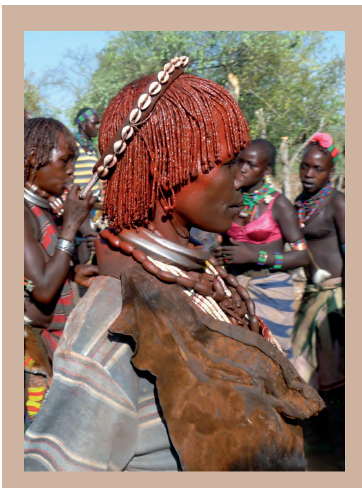
11. ábra. A hamer nők jellegzetes frizurájának tartását természetes anyagok (agyag, vaj) biztosítják

miközben érzelmileg is neveljük diákjainkat. Az Omo-völgyben élő emberek története, élete, nehézségei globalizálódó, változó világunkban alkalmat adhat küldetésünk teljesítésére nekünk, tanároknak.