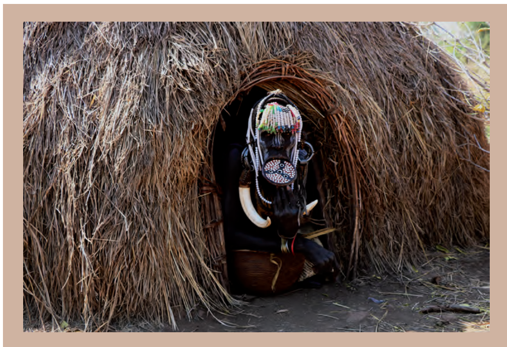
8. ábra. A murszi nők jellegzetes éke az alsó ajakba helyezett ajaktányér (fotó: Mari L.)

A diákok figyelmét igencsak felkeltő testdísz az egyes törzsekre jellemző ajaktányér . A suri (surma), illetve a murszi törzs nőtagjai a mai napig viselik ezeket. A tányér a viselője reprodukív korát is jelzi. A hölgyek ajakbemetszését az első menstruáció után ejtik meg a szülei vagy valamelyik nőrokona. A sebbe egy fadarabot helyeznek, majd fokozatosan tágitják egyre nagyobb fa-, majd agyagtányérokkal. A legnagyobbak elérhetik a 15 cm-es átmérőt is (8. ábra)! A tradíció történelmi gyökerei a rabszolga-kereskedelemre vezethetők vissza. A nők arcuk szándékos eltorzításával „védekeztek”, hogy az idegenek ne hurcolják el őket. Ma viszont így tetszenek a murszi férfiaknak és a turistáknak. A házasság után a feleségek a köznapokban egyre kevésbé viselik, s az alsó ajkukon ejtett lyuk mérete is csökken (9. ábra). Csak ünnepek idején helyezik be a díszüket, és ha turisták érkeznek, akik ezért még pénzt is adnak. Persze ennek is két oldala van, hiszen a tradíció megerősítésében sokszor az odalátogatók is szerepet kaphatnak. A murszik büszkén viselik az ajakkorongot, mivel ez megkülönbözteti őket a szomszéd törzsektől, csoporttudatot ad nekik. Ezzel felhívhatjuk a diákok figyelmét más társadalmakban lévő, hasonló szerepet betöltő jelképekre is!