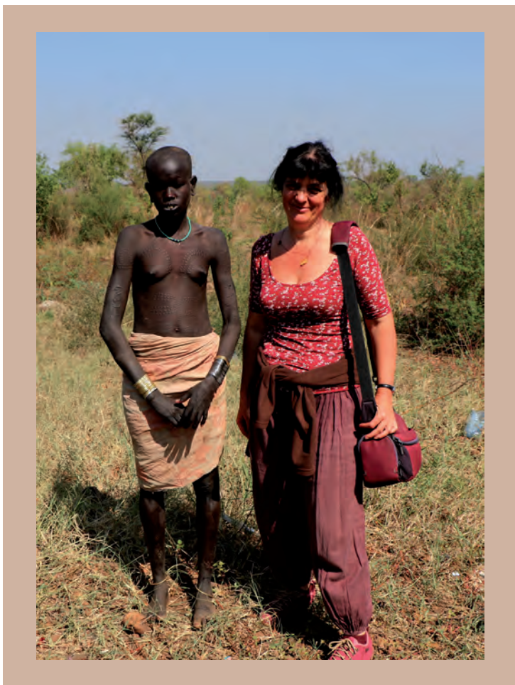
7. ábra. Hegtetoválással díszített fiatal murszi lány

összekevert hamut tesznek bele, hogy domború maradjon (7. ábra). Ez igen fájdalmas beavatkozás, de szinte elvárt; sokan csúfolódás tárgyának teszik ki magukat, ha „gyáván” visszautasítják. Persze üzenete is van, mint minden tetoválásnak. A felnőtt társadalomba lépésre, a bátorságra, férfiak esetében a legyőzött ellenfelekre, küzdelmekre utalnak a jelzések. Az egyes törzstagok „elolvassák” egymás testét, ami a párválasztást is befolyásolja (pl. szexuális érettség). Persze kérdés lehet, hogy ha ezeket az ősi mellkast, hasat vagy vállat díszítő jeleket nyugati típusú ruhával lefedik, eltakarják, hogyan fognak módosulni a „testi üzenetek”? Egyáltalán mi lép a helyükbe?