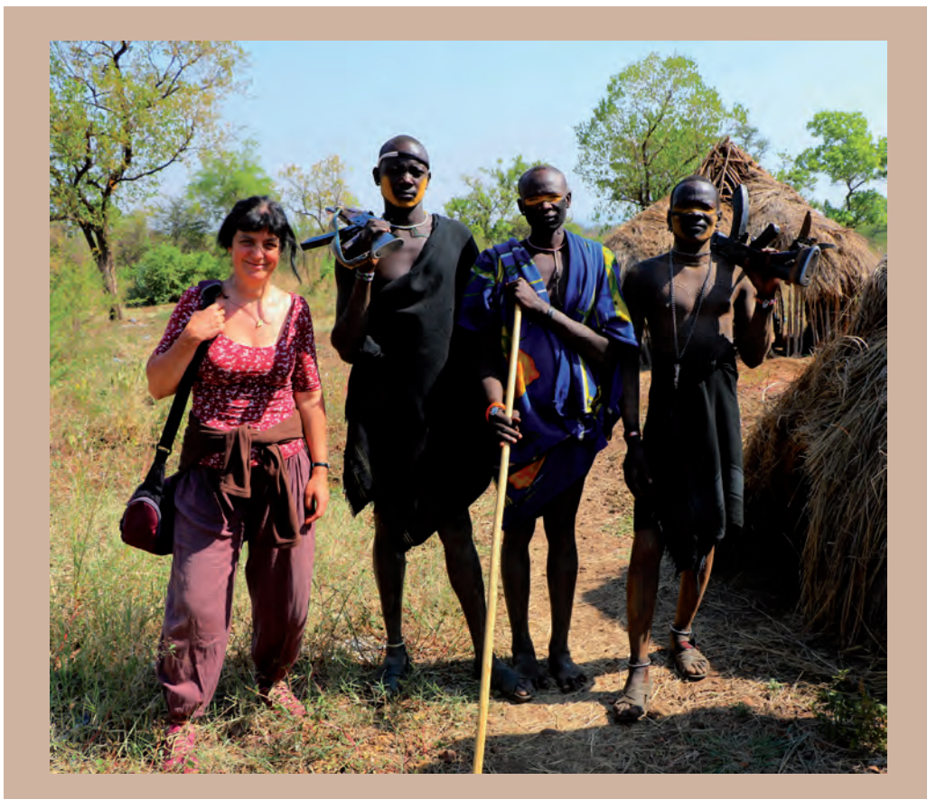
2. ábra. A pásztor törzsek férfitagjainak elengedhetetlen tárgya a lőfegyver

A szavannák hagyományos tevékenysége, az állattenyésztés itt talán nagyobb szerepet játszik a törzsek életében, mint pusztán kereskedelmi árucikk vagy élelemforrás. Az állatok számának gyarapítása a csordákban minden férfi számára kiemelten fontos feladat. Az állomány nagysága lehet a jó házasság alapja. Ez nem véletlen, hiszen a szavannán élő törzsek családjainak legnagyobb értéke a csorda, amit még életük kockáztatásával is megvédenek az állattolvajokkal szemben, akár gépfegyverük használatával is (2. ábra). A betegségekkel szemben legtöbbször úgy védekeznek, hogy kisebb csoportokra osztva legeltetik a jószágot területük különböző részein. A férfiak az állatokat sokszor a feleségüknél is többre becsülik, becézgetik, díszítgetik. Több pénzt költenek a marhák gyógyítására, mint gyermekeik vagy feleségük kezelésére. A legtöbb ének, költemény az állataikról szól. Őrzésük sokkal fontosabb is a család számára, mint a gyerekek iskolába küldése.