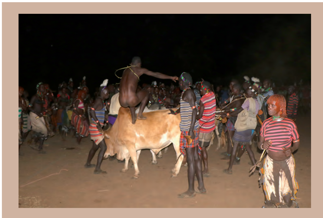
3. ábra. A bikaugrás a férfivá válás próbája

A hamer törzsnél az egyik legfurcsább szokás a bikaugrás , amihez – elnevezésével ellentétben – többnyire teheneket használnak. Ennek teljesítése jogosítja fel a fiataalt arra, hogy feleséget válasszon és saját családja legyen. Ilyenkor a tágabb rokonság is meghívást kap a próbára, és mivel gyalogszerrel jönnek a rokonok, hosszan elhúzódik a szertartás. Sokszor olyan nehezen terelik össze a benne szereplő állatokat, hogy időközben besötétedik. Mi is így jártunk, de ezt csak az esemény megörökítése miatt sajnáltuk. A bikákon átugró fiú egy vékony, spirituális védelmet adó „szíjjal” a vállán átvetve, anyaszült meztelen hajtja végre a próbát (3. ábra). A testét előzőleg homokkal mossa le, mintegy megtisztítva a bűneitől, majd trágyával vonja be, hogy erőt adjon a nem veszélytelen próba teljesítéséhez. Négyszer kell átfutni a szoroson egymás mellé állított állatok hátán, ami nem kis teljesítmény! Ugrás közben a férfiak erősen tartják az állatokat a fejüknél és a farkuknál, de ezzel együtt is megtörténik, hogy leesnek a próbázók, és csak a következő évben futhatnak neki újra a próbatételnek, amelytől a társadalmi státuszuk is megváltozik.