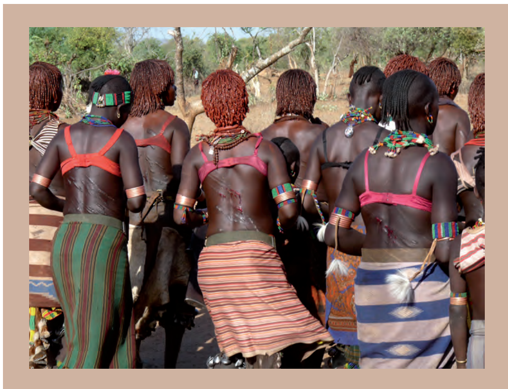
5. ábra. A hamer lányok hátán látható hegek a későbbi „életbiztosításukat” is jelenthetik