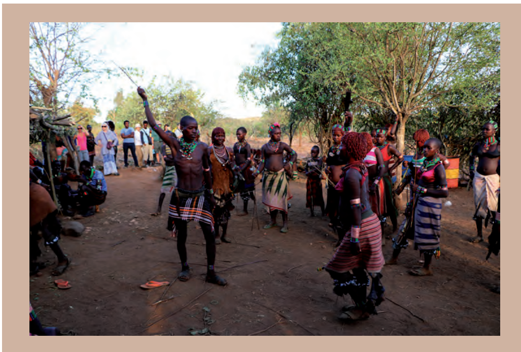
4. ábra. A hamer kultúra része, hogy a bikaugrás napján a család leánytagjai megvesszőztetik magukat

Tapasztalatom szerint a diákokat a furcsa szokások csodálkozásra készítetik, vagy megrémítik, elgondolkodtatják őket. Ezért érdemes a szokások „lelki” hátterével is foglalkozni, megmutatni nekik azt, hogy vajon miből nőtt ki magát az a tradíció, ami számunkra idegen. A bikaugrás próba előtti rituálé pontosan egy ilyen hagyomány. A férfitá avatás eseményén a nők a vendégek előtt megostoroztatják magukat a fiatal férfi családtagok által (4. ábra). Ez a lányok részéről a kitarítás és a fájdalomtűrés próbája, megmutatják, hogy képesek akár szenvedni is fiútestvérükért, férfi rokonaikért. És hol található ebben a földrajz? A hamerek a szavannán állandóan ki vannak téve a természet „szeszélyeinek”, pl. a szárazságnak, a sáskajárásnak, a földek kimerülésének. Sokszor kerülhetnek olyan helyzetbe, hogy éheznek, mert nincs elég kukorica, cirok. Ekkor a „megkorbácsolt” lány nyugodtan fordulhat a hátán sebeket ejtő férfihez segítségért, aki rendszerint nem is tagadja meg azt. Így a behegedő sebek tömege (5. ábra) akár a túlélést is jelentheti a lányok számára. A fiúk nem dühből vernek rá a lányokra, sokszor ráncigálással, csúfolódással kell biztatni őket, hogy kötélnek álljanak. Mindenesetre az ott tartózkodó turistákat gyakran meborzongatja ez az ősi tradíció.