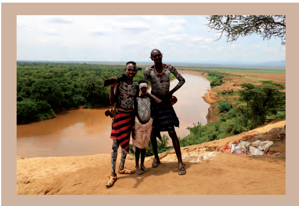
10. ábra. Testfestéssel díszített karo férfiak az Omo folyó partján

A szépségért meg kell szenvedni, tartja a mondás, ami itt, az Omo-völgyben különös tartalmat kap. A murszicznál és a suriknál az ajaktányér behelyezéséhez szükséges az alsó metszőfogak kiverése, ami igencsak komoly fájdalmakkal jár. Ezeket a brutális beavatkozásokat egyre többen tagadnák meg, de a törzsi elvárások, a szülők és az azonos életkorú társak nyomása igen nagy, nem könnyű „szembemenni” a tradíciókkal. Ugyanakkor az agresszív eljárás egyben a felnőtt- vagy házasulandó kor elérését is jelzi, ami fontos üzenettel bír. Megtagadása kirekesztéssel is járhat, ugyanis a legnagyobb szégyen érheti a törzsben: gyávának tartják.