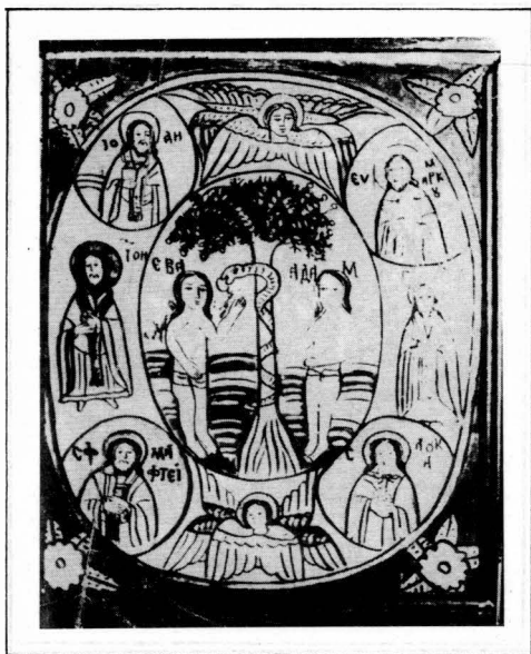
Figura 11. Adam și Eva Scheii Brașovului sec. XIX, col. Muz. Naț. Secuiesc, dimens. 35 x 30 cm, nr. inv. 7359