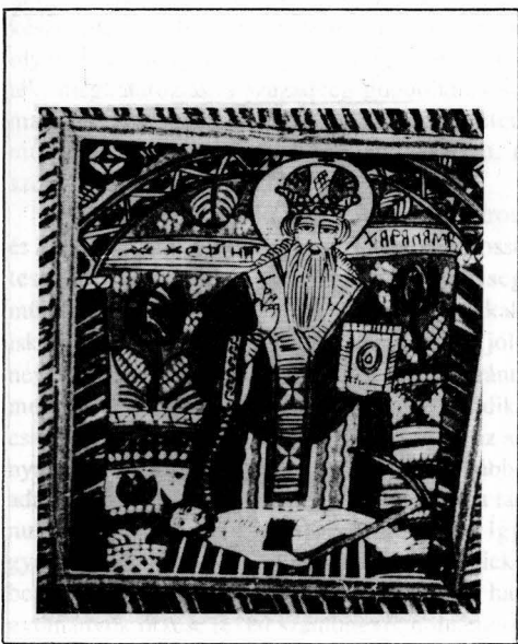
Figura 7. Sf. Haralambie

Scheii Braşovului sec. XIX, col. Muz. Naţ. Secuiesc, nr. inv. 7388