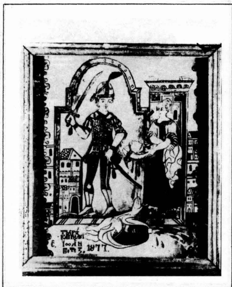
Figura 12. Tăierea capului Sf. Ioan Botezătorul Țara Oltului, dimens. 50 x 45 cm, propr. Nicolae Moldovan