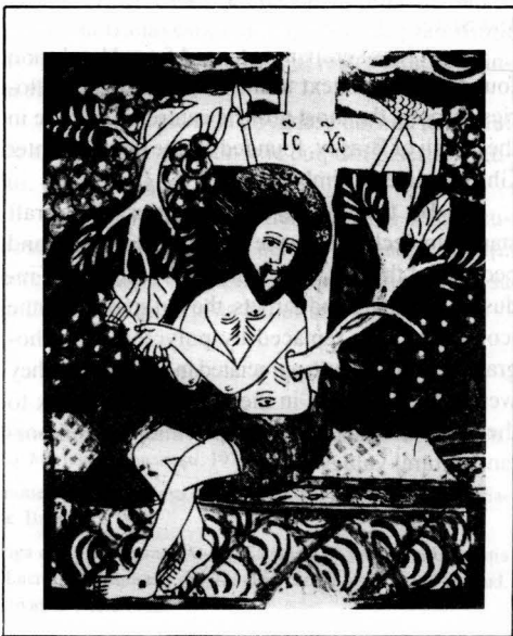
Figura 3. Isus cu vița de vie. Scheii Brașovului sec. XIX, col. Muz. Naț. Secuieșc, dimens 38 x 33 cm, nr. inv. 6152