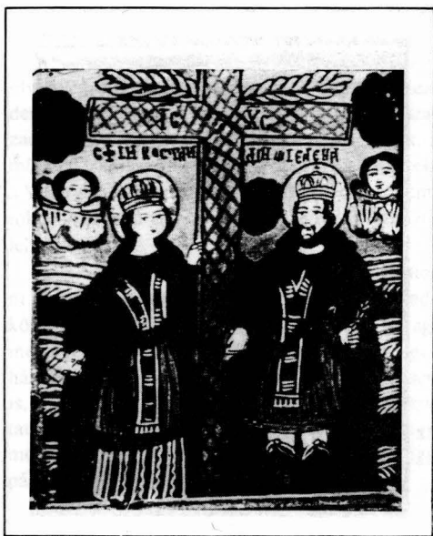
Figura 8. Sf. Constantin şi Elena