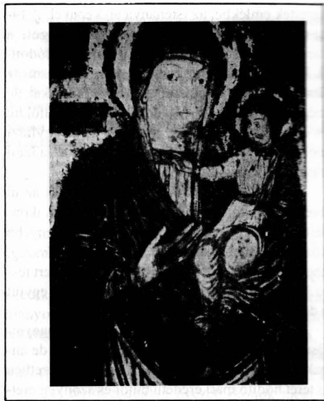
Figura 2. Icoana Miraculoasă de la Nicula Pictat de preotul Luca din Iclod la 1681, dimens. 80 x 50 cm.