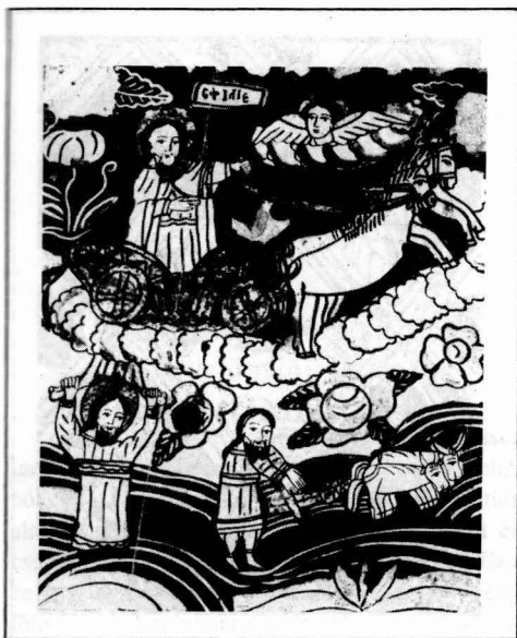
Figura 5. Sf. Proroc Ilie

Scheii Braşovului sec. XIX, col. Muz. Naţ. Secuiesc, nr. inv. 6153.