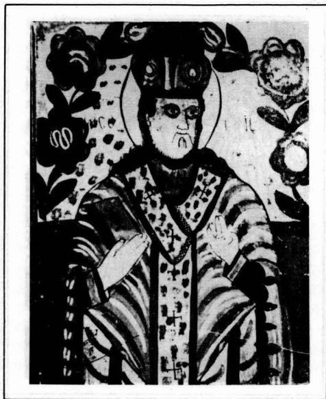
Figura 9. Sf. Nicolae Nicula, sec. XVIII, col. Muz. Naț. Secuiesc, dimens. 43 x 33 cm, nr. inv. 7719