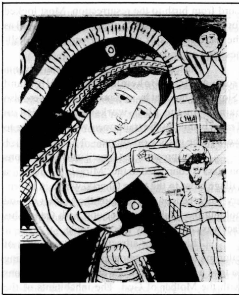
Figura 1. Maica Domnului Jalnică Făgăraș, sec. XIX col. Muz. Naț. Secuieșc, dimens 38 x 34 cm, nr. inv. 7724