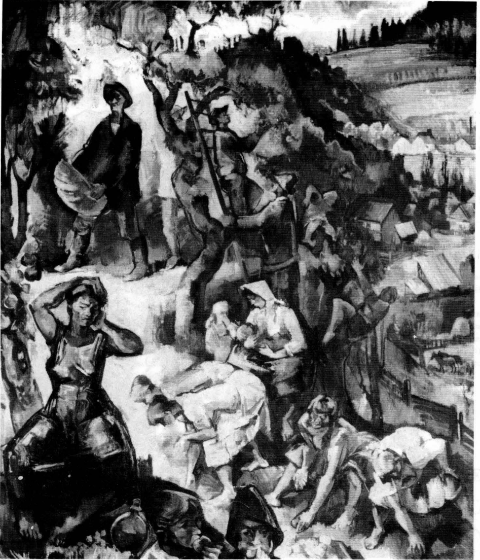
2. ábra Almaszedés. (olaj, vászon)