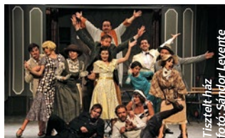
Tisztelt ház