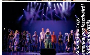
Képzelt riport egy amerikai popfesztiválról