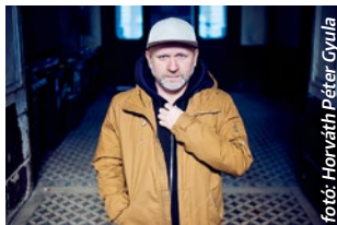
fény: Horváth Péter Gyula