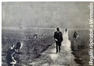
Illegális rópiatok a Vérmezőn

S zabó Ervin 1916-ban leírt kifejezését vette kölcsön a projekt címe. A kultúra hozzáférhetőségének kérdésével foglalkozik könyveken, történeteken, szövegeken keresztül.