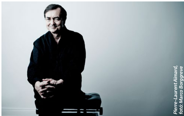
Pierre-Laurent Aimard