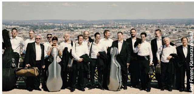
fest: Ferenc Kamarazsnekét

📍 Müpa 📅 FEBRUÁR 15. – 20.00 💎 2200 Ft / 2900 Ft / 3200 Ft 🌐 mupa.hu