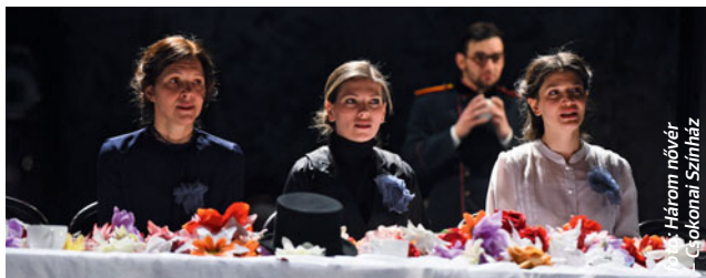
Három nővér Egókoni Színház

H ét nap, nyolc előadás – jelentős, de sok élményt ígérő vállalás annak, aki a Vidéki Színházak Fesztiválját végigüli. Különleges produkcókat láthat a budapesti közönség, köztük a POSZT-on elismert klasszikus nagyopereket, a stílusosan megrendezett kecskeméti Csárdáskirálynőt és a lírai, de a humort