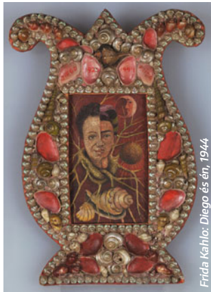
Frida Kahlo: Diego és én, 1944

📍 Magyar Nemzeti Galéria 📅 NOVEMBER 4-ig k-v.: 10.00–18.00 💎 900 Ft / 1800 Ft 🌐 mng.hu