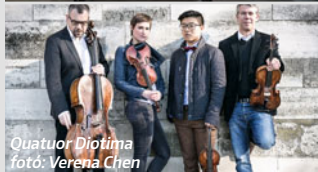
Quatuor Diotima