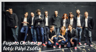
Fugato Orchestra

27. CAFÉ BUDAPEST KORTÁRS MŰVÉSZETI FESZTIVÁL