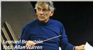
Leonard Bernstein

A természetben az ősz az elmúlásról szól, a kulturális élet viszont éppen ilyenkor pörög fel igazán. A CAFE Budapest idején pláne. A régió egyik legfontosabb kortárs művészeti fesztiválja a jelenre, az itt és most élményére, korunkra reflektál, legyen szó kiállításról, könnyűzenei koncertről, operáról vagy köztéri performanszról, a kortárs alkotások minden esetben izgalmas feladat elé állítanak – kérdéseket vetnek fel, elgondolkodtatnak, kimozdítanak a komfortzónánkból, vagy éppen új megvilágításba helyezik azt, amiről azt gondoltuk, már ismerjük.