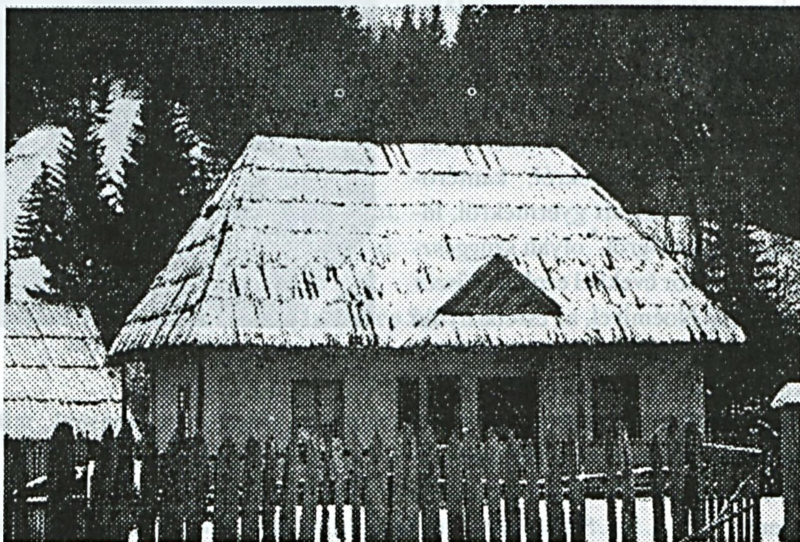
Régi Kostelecki ház

A ház "négy szegiben" lévő "négy angyal", s a középen elhelyezkedő "aranyszék" az emberiség egyik legősibb jelét, az osztott négyzetet írja elénk, amely "a látható és érzékelhető világ alapszerkezetének (fönt-lent, bal-jobb) jele, s egyben égtájmeghatározó, a tájékozódás elengedhetetlen eszköze.". (Molnár V. József: Vázlat a természetes modellezéshez, Debrecen, én. 7.o. ) A négyes osztás négy sarka és négy mezeje általában egynemű (négy angyal), a Középpontban azonban, amely igen szoros kapcsolatban áll a "világ köldöke", "világ közepe" képzetekkel, mindig valamilyen magasabb minőség tételeződik, hiszen a "világ közepén" találkozik egymással a Menny, a Föld és a Pokol. (vö. Mircea Eliade: Az örök visszatérés mítosza, Európa, Bp. 1993. 28.o. ) A világ középpontjában, a saját házában lévő ember így a mindenség teljességéről szerezhet tudomást, "felfelé" és "lefelé" is tájékozódhat. A szoba-kozmosz középpontjában ezúttal előbb a Fiát kereső Mária, majd maga a kereszthalálát elbeszélő Jézus Krisztus jelenik meg.