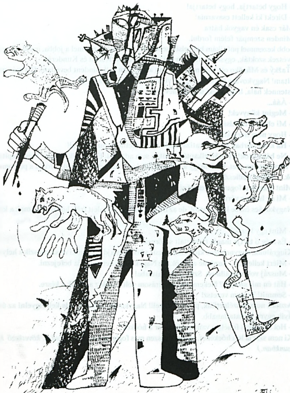
Drosznyik István : Ne bánts az állatokat