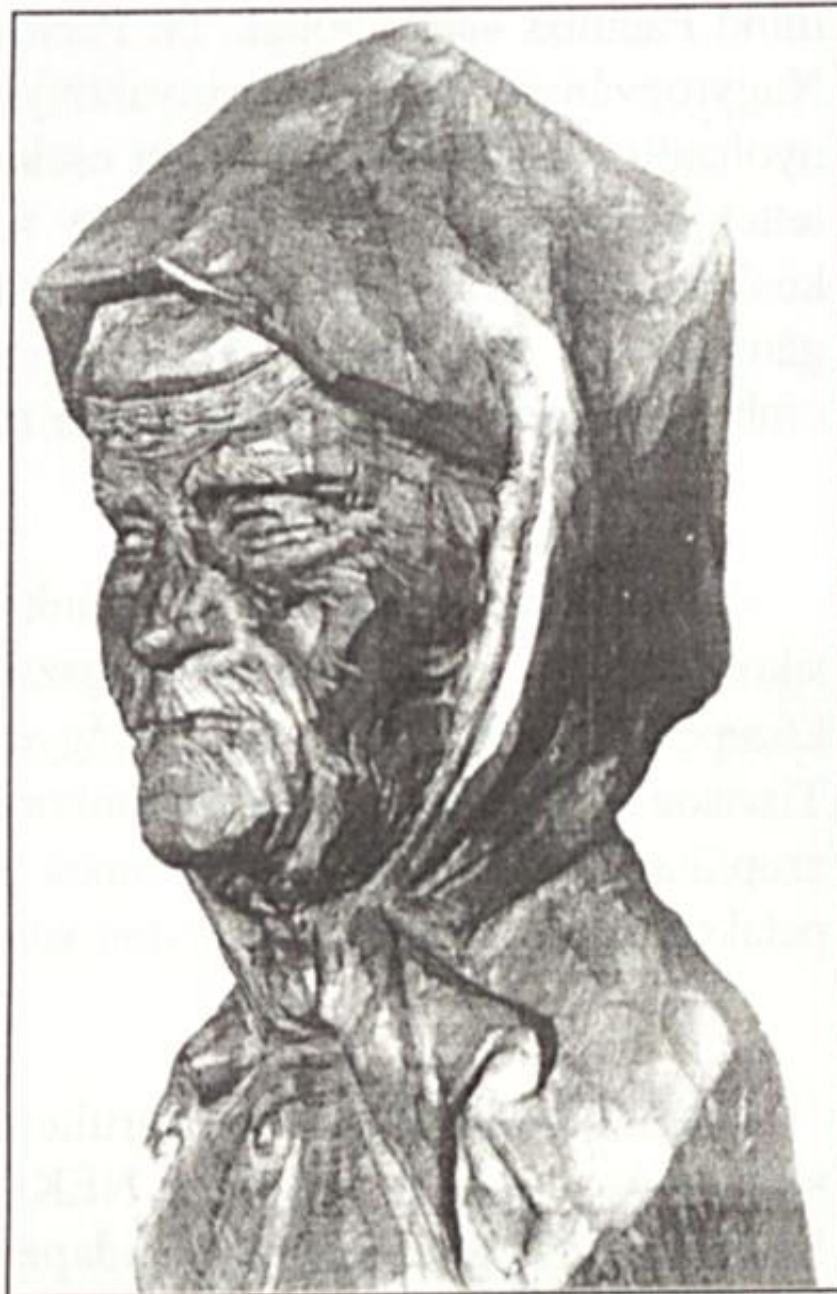
id. Szabó István: Öregasszony