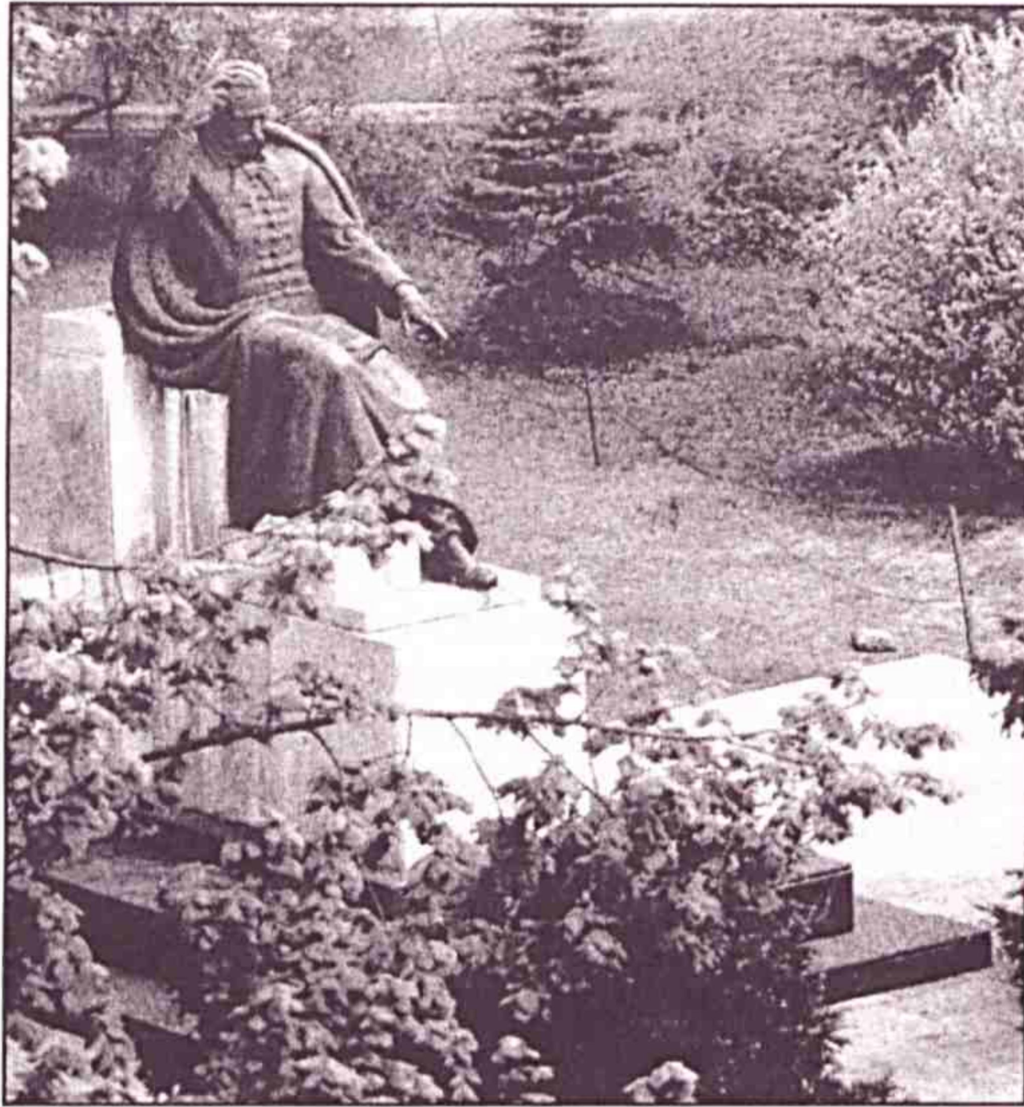
Sidló Ferenc Madách-szobra Balassagyarmaton