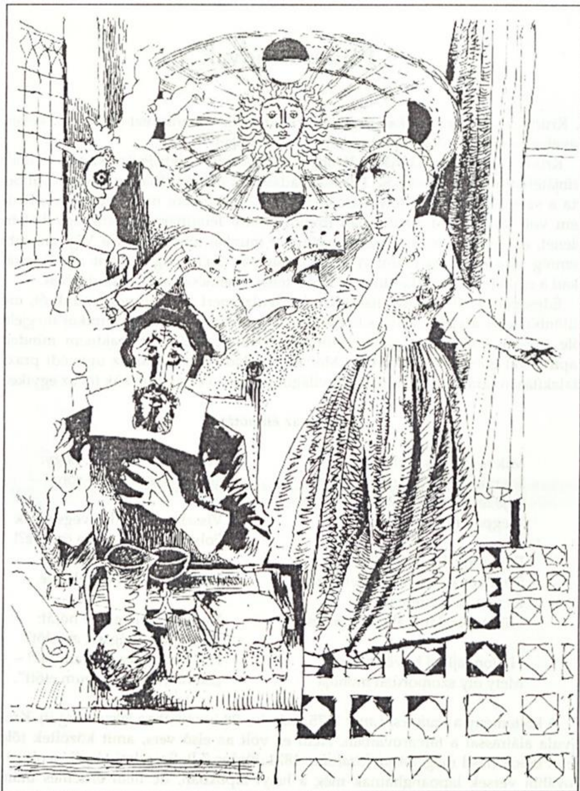
VIII. Prágában (1980)