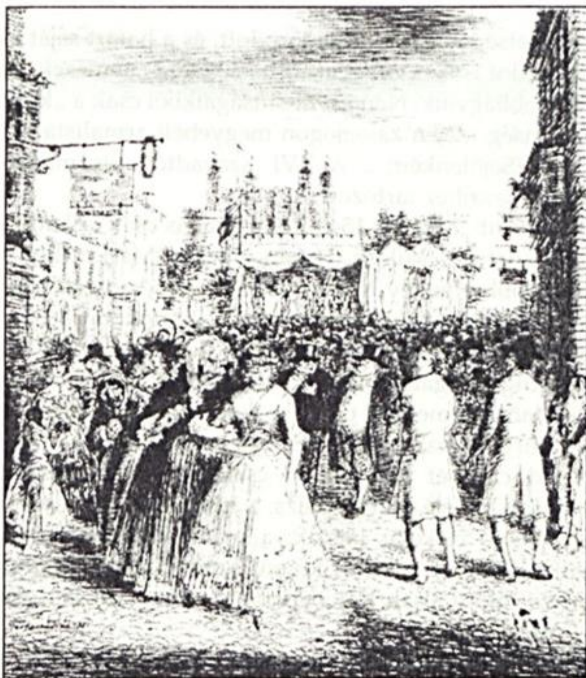
XI. Londonban (1951)

Az első hetet töltöttük Bonchidán, amikor megérkezett az orvos karpaszományosok egy részének örvezetővé való előléptetése. A két román fiú, valamint Gerasin a kórházban nem kapott csillagot. Egy csillag birtokában hihetetlenül nagyot léptünk előre a katonai hierarchia lépcsőin: tisztesek lettünk! Felvarrtuk hajtókánkra a csont-csillagot, a „krumpli-virág”-ot, és a „szél már megakadt benne”. Mindennapi eltávozás járt vele.