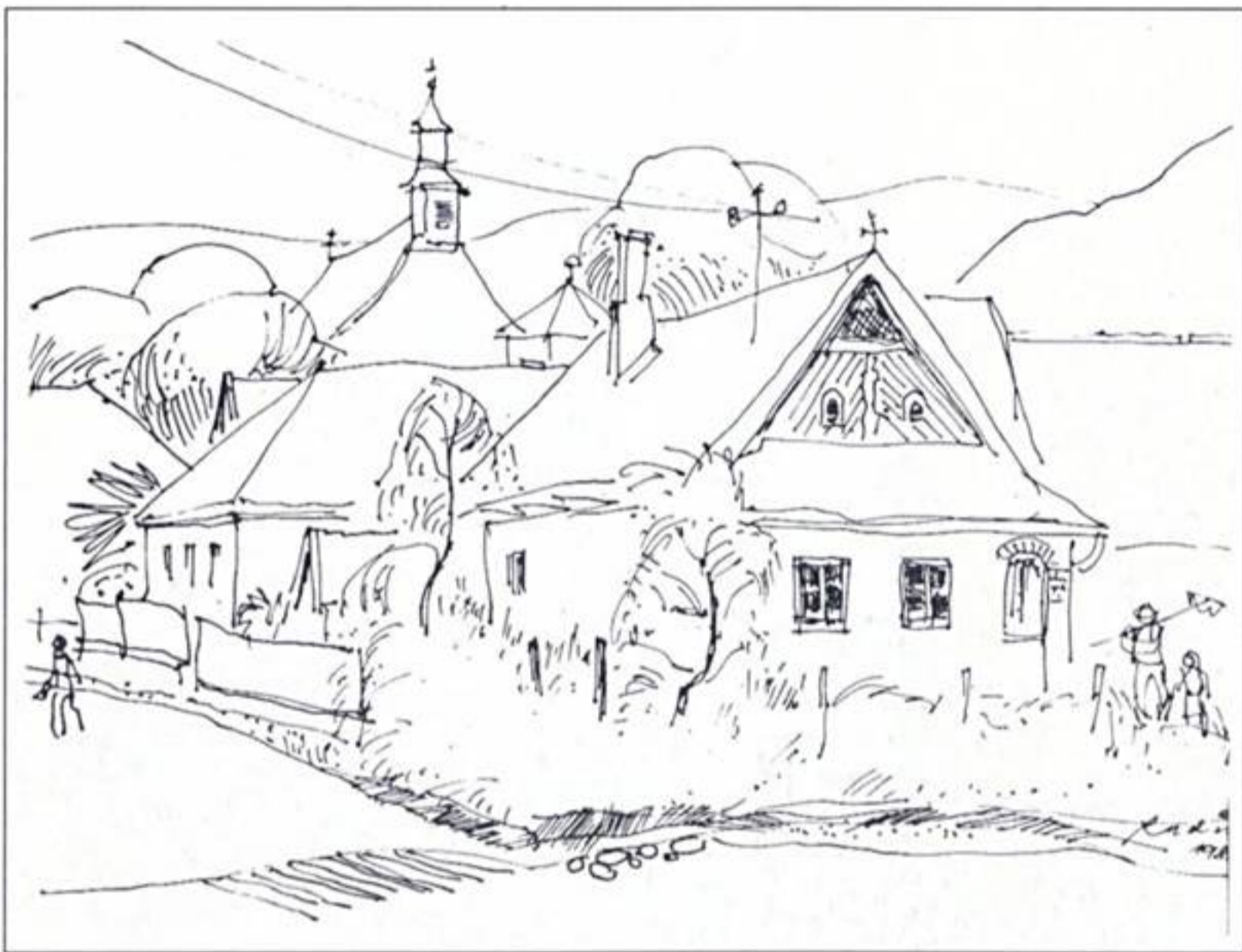
Radics István: Erdésház (toll, 23 x 31 cm)