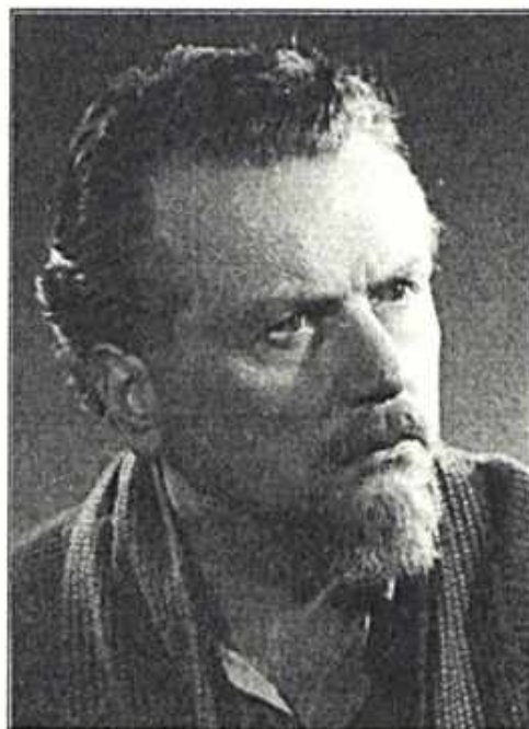
Szabó Gyula arcképe (1959)

Szabó Gyula, Losonc városának egyik legismertebb festőművésze 2007-ben lenne 100 éves. Lenne, mert a Mindenható már jóval korábban, mondhatnánk idő előtt magához szólította. Ugyanakkor megkapta azt a tisztességet, hogy élete, munkássága, festményei, írásai és versei kitörölhetetlenül beíródtak a város, a régió és az egyetemes művészettörténet krónikájába. Alkotásaiból jött létre a losonci Nógrádi Galéria 2 , nevét viseli a „Szabóov grafický Lučenec” (Szabó grafikus Losonca) c. országos hatáskörű képzőművészeti vetélkedő, a duna-szerdahelyi magyar tannyelvű általános iskola. A losonci Szabó Gyula Baráti Társaság Szabó Gyula Galéria létrehozását tűzte ki legfőbb céljául, valamint életműve részletes feldolgozását. Munkásságának csak egy részét ismerjük, hiszen írásai, versei, filozofikus ihletésű jegyzetei nagyrészt feltáratlanul várják, hogy felfedezzék őket.