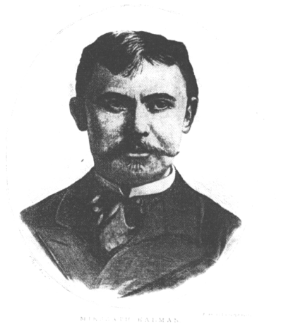
11. Mikszáth Kálmán fényképe az elbeszélő költemény megjelenésének évéből, 1882-ből – a felvétel történetét A saját ábrázatomról című elbeszélése mutatja (Az Országos Széchényi Könyvtár állományából)