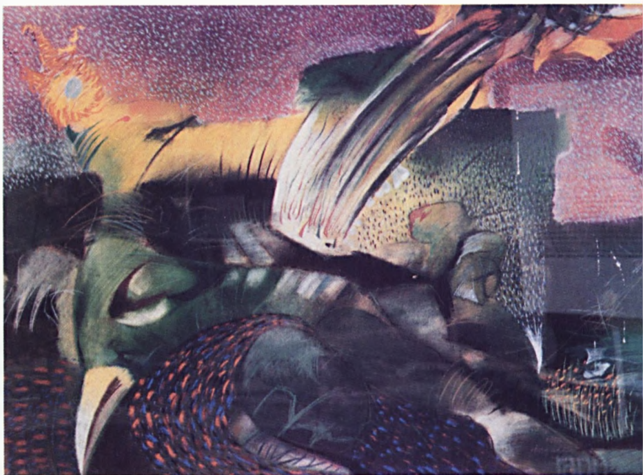
Hegedűs Morgan Van Gogh virágai (pasztell) - 1990