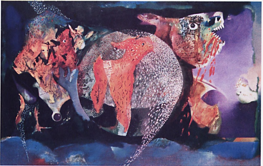
Hegedüs Morgan Születések (vegyes) - 1989