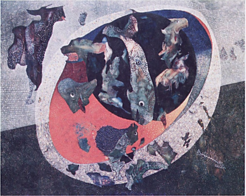
Hegedüs Morgan Környezet (pasztell) - 1987