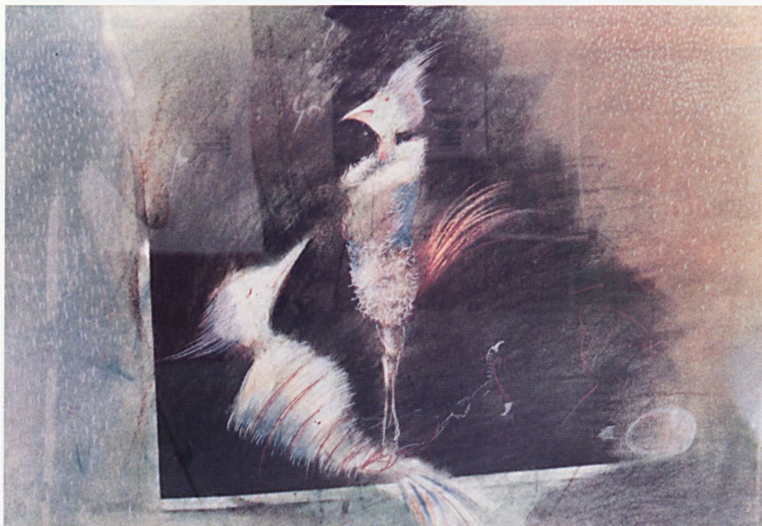
Hegedűs Morgan Mit nekem (pasztell) - 1990