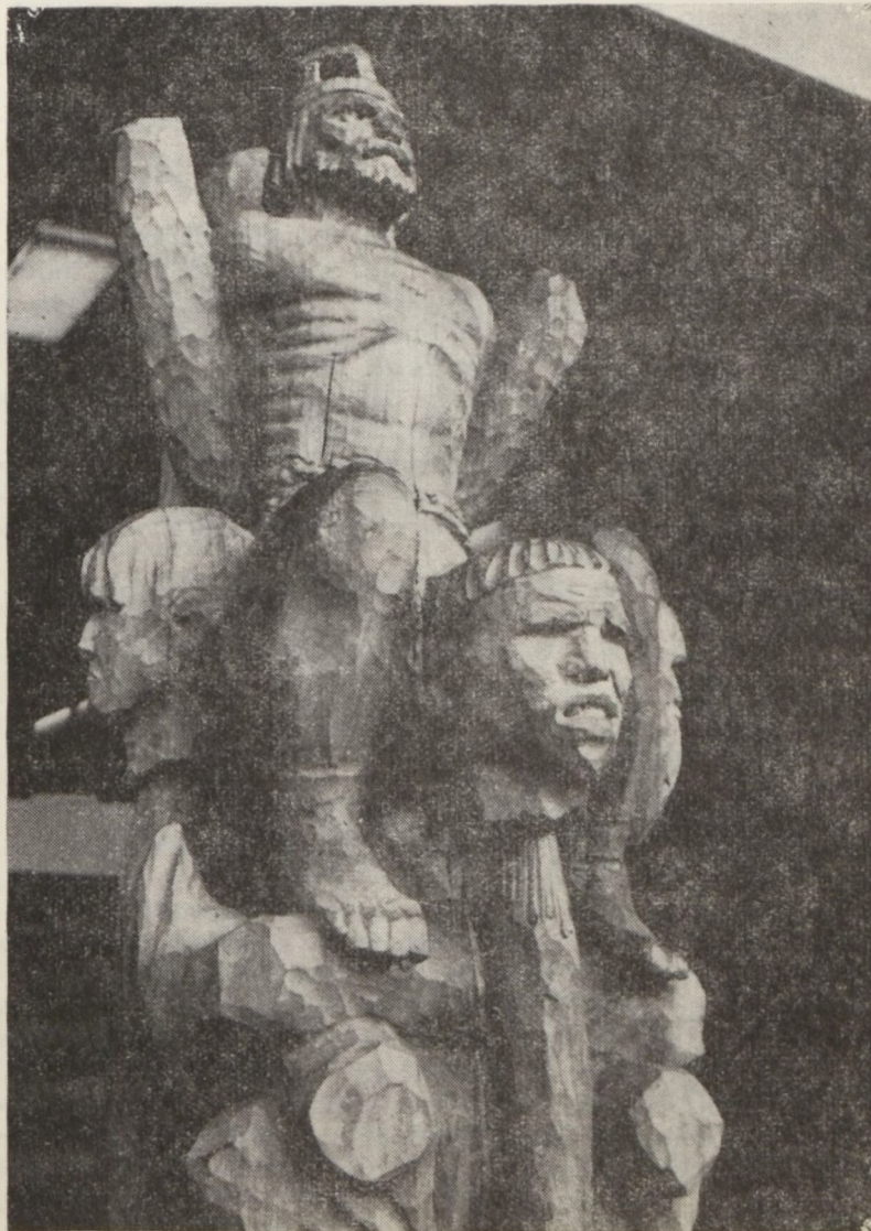
id. Szabó István: DÓZSA

Befejezésül hangsúlyozni kell, hogy az üzemi demokráciát folyamatként kell felfognunk, olyannak, amely állandóan mozgásban van, fejlődik, szélesedik, amelynek érdemi kibontakozása társadalmi és gazdasági helyzetünk fejlődésének függvénye.