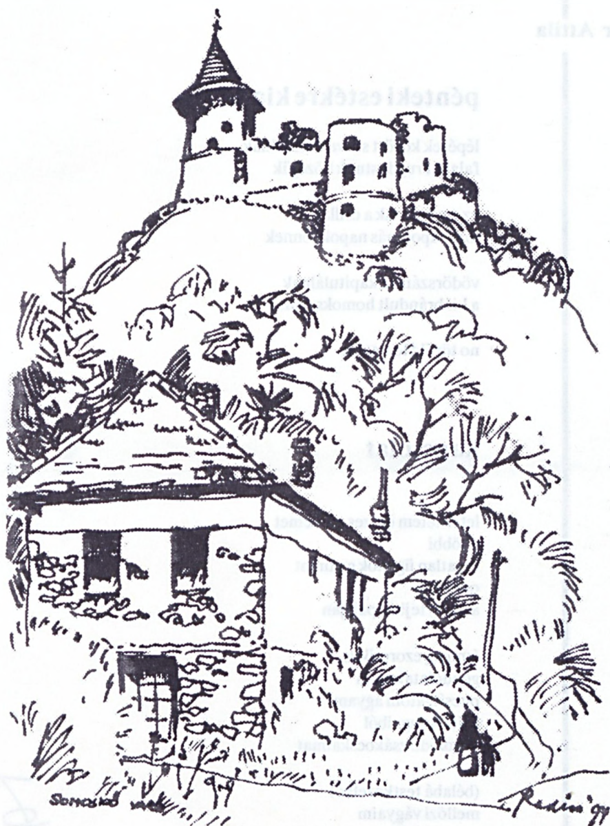
Radics István : Somoskő vára