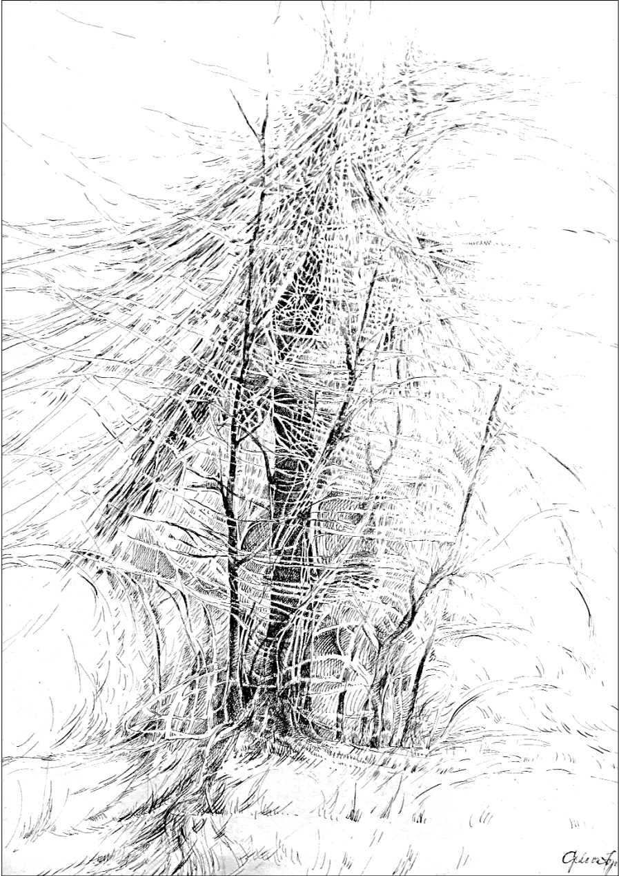
Gedeon Hajnalka: Meditáció Meotisról (tusrajz)