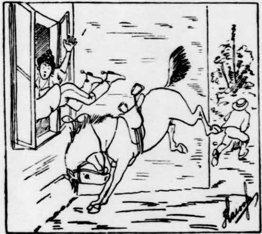
És lovagja Belerepül az ablakba.