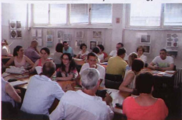
Magyar nyelvtanfolyam a Nemzeti Kisebbségek Klubjában

1956-os magyar forradalom és szabadságharc eseményeire. A kirándulásra az egyesületek tagjait elkísérték Magyarország Nagykövetségének tagjai is, élükön Négyesi József nagykövet úrral. Közösen szerveztünk a magyar államalapításról való megemlékezésre egy műhelymunkát fiataljainknak. Egyesületünk tagjainak gyermekei és unokái Magyarország címerét láthatták, megismerkedhettek a magyar zászló színeivel, amelyet saját kezűleg készíthettek el, játék közben elsajátíthattak néhány magyar kifejezést, és a csárdás alaplépéseit is megtanulták. A műhelymunka teljes egészében sikeres volt, és a jövőben is szervezünk majd hasonló rendezvényeket. Fontos, hogy a fiatalság is megismerje a magyar nyelvet és a hagyományokat. A művelődés területén megemlíteném a Kelet-Közép-Európa