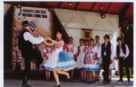
KUD „ Sivarvanj “ iz Kernjea u Banja Luci