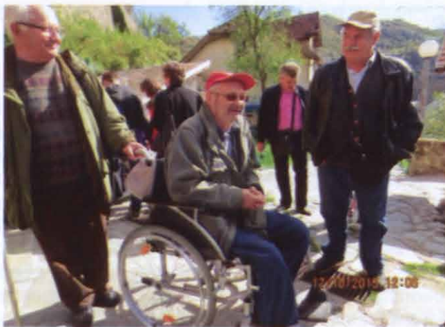
Az első közös kirándulása a két boszniahercegovinai magyar egyesület tagságának (Jajce)

anyaországunk segítségével honfitársainknak, akik valamikor a magyar lakosságot képezték. Ez egyedülálló példa Bosznia-Hercegovina területén. A komoly munkán kívül alkalmunk volt szórakozni is. Megünnepeltük a nemzetközi nőnapot, kirándultunk a Kozara hegyre, megünnepeltük egyesületünk fennállásának évfordulóját, az év végén kiadtuk az Új Dobos 9. számát. Úgyszintén ez idő tájt került megszervezésre a kétnyelvű (immár hagyományos) irodalmi est is, amelyre ez alkalommal Böndör Pált hívtuk meg. Idén ellátogatott hozzánk Tari István, aki szintén irodalmi estet tartott. A múlt évet egy örömteli eseménnyel zártuk, ugyanis karácsonyi fogadáson voltunk Szarajevóban, Magyarország nagykövetének és feleségének meghívására.