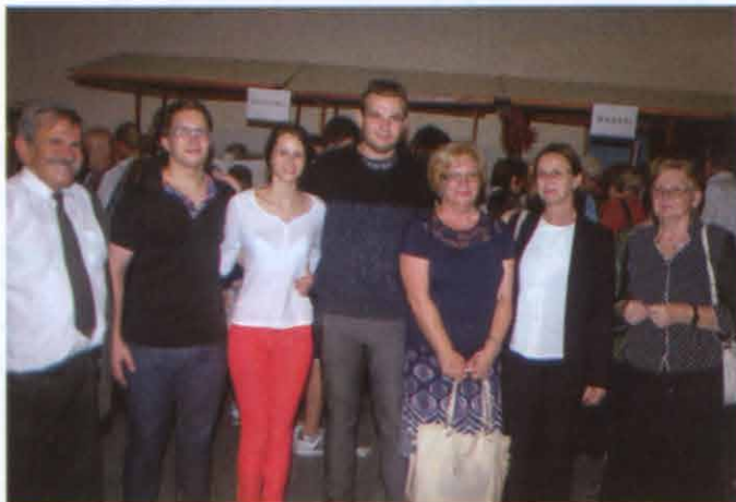
Učenici muzičke škole Vaci Bartok-Piketi sa Đenge Anikom, prvim diplomatom Ambasade Mađarske i dijelom uprave „Magyar Szó“-a

narodnih pjesama iz Kalotasega ( Kalotaszeg ) i pobrali veliki aplauz publike. Bila je i prezentacija nacionalnih jela gdje smo naravno uzeli učešće. Bio je bogat izbor raznih đakonija, naravno i kvalitetnih mađarskih vina koji su bili poklon od strane ambasade Mađarske iz Sarajeva. Među pozvanim gostima bila je i Đenge Aniko ( Gyenge Anikó ), zamjenica šefa misije mađarske ambasade iz Sarajeva. Ambasade zemalja Višegradske četvorke organizovale su filmsku nedjelju sa nazivom „V4 film festival“ i to u Sarajevu i Prijedoru. Naši članovi iz Prijedora su se postarali, da obavjeste svoje prijatelje i rodbinu da posjete filmski festival i zaista puno ljudi je uživalo u prikazanim filmovima. Nama je bio posebno interesantan mađarski fim Lisičja vila.