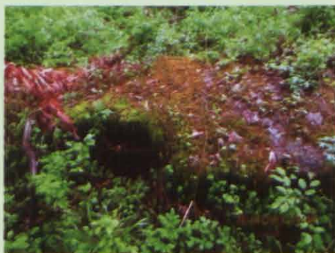
Jedina još prepoznatljiva grobnica na Mađarskom groblju