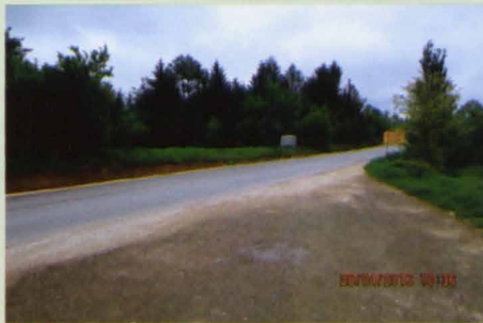
A szembeni kis tisztáson volt állítólag az olajprés tulajdonosának a háza

földárak miatt tízezrek áramlottak a szomszédos régiókba: Horvátországba, Ó-Romániába és kisebb arányban Bosznia-Hercegovinába is. 1878 után a török lakosság szinte teljesen, de nagyszámú mohamedán vallású lakos is kiköltözött Boszniából. Prnjavor és környéke is viszonylag elnéptelenedett. Ukránok, lengyelek, olaszok, németek és magyarok telepedtek le a szabad területekre. Az enklávék tehát megélhetési okokból, spontán módon jöttek létre a Száva jobbpartján. A magyarok migrációját a budapesti kormányzat csak 1909 végétől ösztönözte. Sarajevóban, Mostarban, Brčkon, Bijeljinán, Ljeljenčén, Zavidovičín és a Prnjavor melletti Vucsijákon létesült néhány száz fős magyar kolónia.