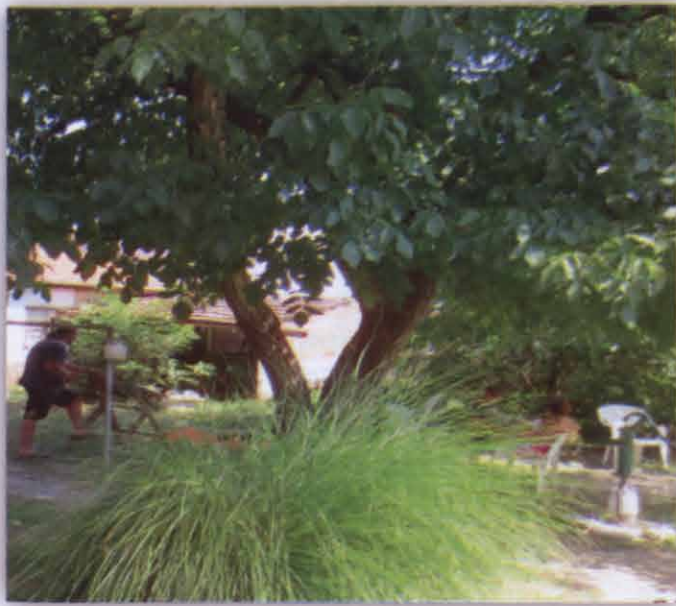
Stari orah i ukrasni šaš u novosadskom dvorištu

druge i šećer je toliko bio sitan, da sam nehotice napravila to što sam napravila. Sreća moja luda da sam imala odličan odnos sa svekrvom, pa me je to spasilo kao i činjenica da je i naša kafa bila slana koju, naravno, niko nije popio.