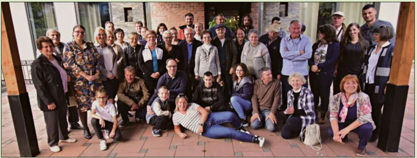
A Banja Luka-i és a sarajevói magyarok évente egyszer közös találkozót szerveznek

éven át. Onnan mentem nyugdíjba. Lehet, hogy még maradtam is volna, de megjelent egy pályázat, amelyben a Boszniai Szerb Köztársaság magyar nyelvű bírósági tolmácsot keresett, megpályáztam és lehetőséget kaptam arra, hogy dolgozzak. A pályázati bizottságban volt egy újvidéki tanár is. Bírósági tolmács vagyok, az egyetlen a Boszniai Szerb Köztársaságban, aki magyarul tud, így mindent, amit fordítani kell, nekem adnak, s ha magyarországi vendég érkezik, segíték a kommunikációban. Emellett vezetem az egyesületet. Mindennek köszönhetően napi szinten használom a magyar nyelvet, és örülök is annak, hogy így alakult a sorsom.