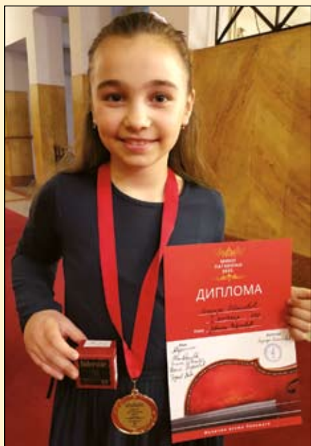
Az idei Mini Paganini versenyről aranyéremmel tért haza Belgrádból

Az itt élő idősebb emberek még tudtak magyarul, ápolták is anyanyelvüket, de gyerekeik már kevésbé, unokáik pedig már nemigen tudtak kitől tanulni, a nagymamák, nagytaták közül sokan meghaltak, de egyre ritkultak a kapcsolatok az otthoni rokonokkal is, egyre ritkábban találkoztak, úgyhogy lassan kikopott a magyar nyelv a boszniai magyarokból. Legtöbbször a Vajdaságból érkeztünk, sok-sok évvel ezelőtt. Ide házasodtunk, itt kaptunk munkát. Valamennyien vegyes házasságot kötöttünk, az iskolákban nem volt és most sincs anyanyelvápolás, egymásról sokszor nem is tudtunk, ha tudtunk is, ritkán találkoztunk. Egyesületünk sem volt mindig, 2003-ban alapítottuk a Magyar Szót. Szarajevóban a HUM Magyar Polgárok Egyesülete még a múlt század kilencvenes éveiben alakult, de nem művelődés,