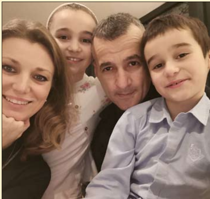
Együtt az Otašević család

Megjelent az újvidéki Magyar Szó napilapban