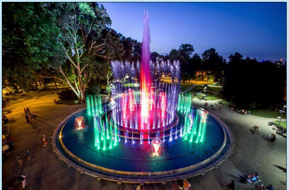
Muzička fontana, Margitino ostrvo