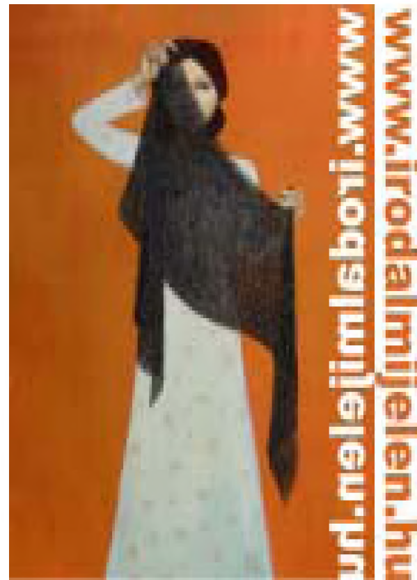
Kiss Márti festménye

akartam tudni, hogy mit énekel a madár, s nem csak azt, hogy hogyan és miért. Azt szeretném megérteni, mit dalolnak egymásnak a bálnák a tengerek mélyén, s nem azt, hogy mért vetik magukat a partra újra és újra. Mert utóbbit már tudtam. Többször partra vetettem magam a pannon sárban, mint valami déltengeri bálna, de mindig visszadobott a hullámok közé az egyes emberek szeretete. Philia tartott életben, s hozott vissza az önrömbölésből, és a halálból mindig.