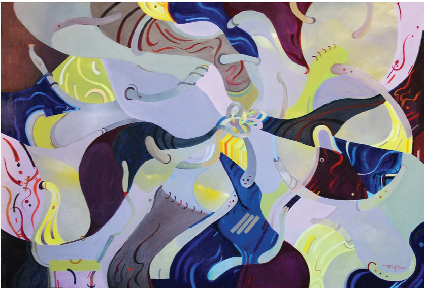
Kettő Groza János festménye

– Az apósom tizenhét éves korában lépett a bűnbe, és ezzel, akaratlanul, megmentette a bőrét, de elárulta az igazságot, vagy amit annak gondolt. Hiszen az igazság... – mondta Lőrinc csúfolódva – Hiszen mi is az igazság? Nem lehet az, hogy az igazság csak egy halom eszme, melyet megfogni éppen olyan illúzió, mint a kettőről azt mondani, hogy három?