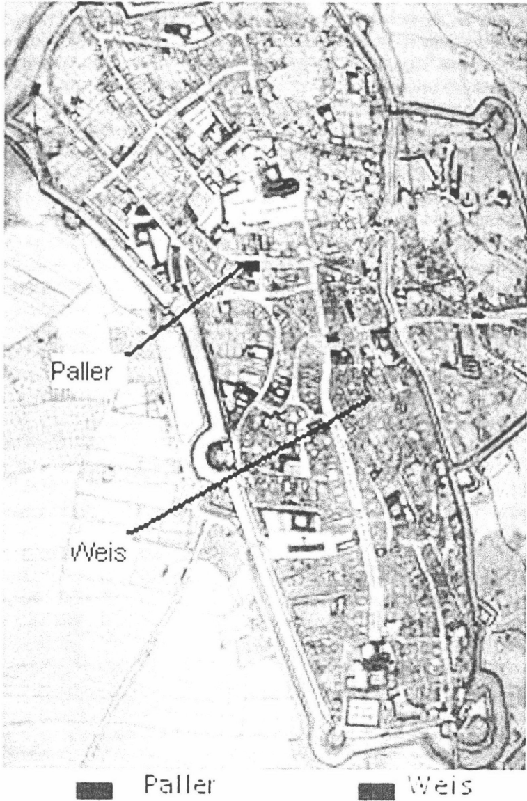
3. ábra. A dunai útvonal kereskedőinek lakhelye Augsburgon belül