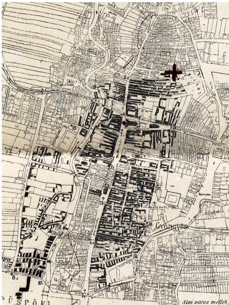
Gyöngyös térképe a tűzvészben károsult házak feltüntetésével. Vargha Tivadar: Jelentés a Gyöngyösi járás tűzrendészeti állapotáról az 1917. évben. H, n., [1918] c. művének melléklete. (részlet)