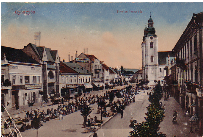
Gyöngyös, a Hanisz Imre tér 1917-ben, képeslap. Divald és Monostory kiadása, Budapest. Mátra Múzeum, ltsz.: 73.1.49.

és a postaépületet.” 66 Ezen a területen a szabályozási vonalak, a telekméret és a beépítési mód meghatározásán túl határozottan törekedtek a korábbi – a megelőző évtizedben jelentős átalakulásokon átesett – városkép átformálására, egységesítésére is.