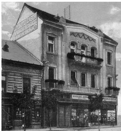
Gyöngyös, Hanisz Imre tér, Kálmán Ignác háza, 1912–1917 k. Képeslap, Szántó és Pampuk. kiadása, Gyöngyös. Mátra Múzeum, Itsz.: 86.352.1. (részlet)