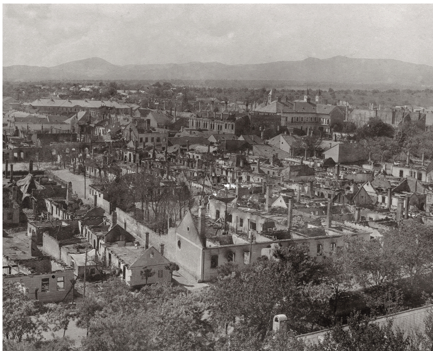
Gyöngyös látképe a ferences templom tornyából, 1917. május után. Magyar Nemzeti Múzeum Történeti Fényképtár, ltsz.: 68.66.

és szabályozása kérdéseinek önálló intézésére, s határozatok hozatalára” egyhangúlag fel is kérték a kormányt egy kormánybiztos kinevezésére. 26 A rekonstrukciót tehát – akár a városi autonómia korlátozása árán – közvetlen állami vezetés alá kívánták helyezni. A katasztrófa léptékét, a háborús helyzetet (anyag- és munkaerőhiány, a gazdaság militarizálása, szállítási nehézségek), illetve a megfelelő városi apparátus hiányát (a mérnöki hivatal szakszemélyzete mindössze egy főmérnökből és egy útmesterből állt 27 ), valamint a helyi építőipar