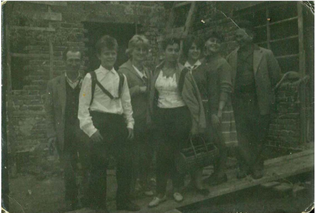
A gyárral Agárdon

di fényképet, ami az üdülőépítkezést megszemlélő gyári kirándulás alkalmával készülhetett.