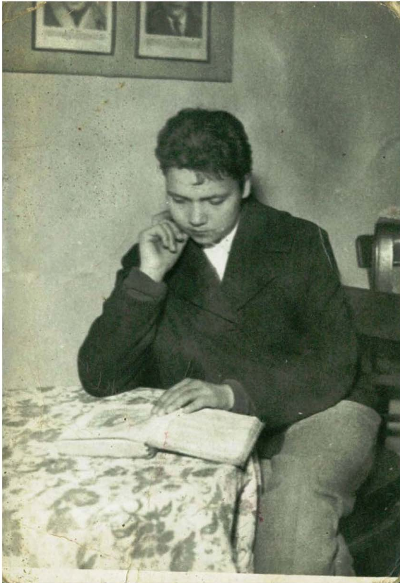
A gyár könyvtárában