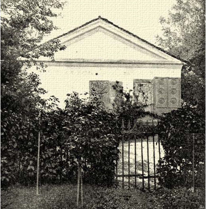
A zsidó Wesselényi kriptája a XX. század elején (Kardos Samu: Bárány Wesselényi Miklós élete és munkái. I. köt. Budapest, 1905. 25.)