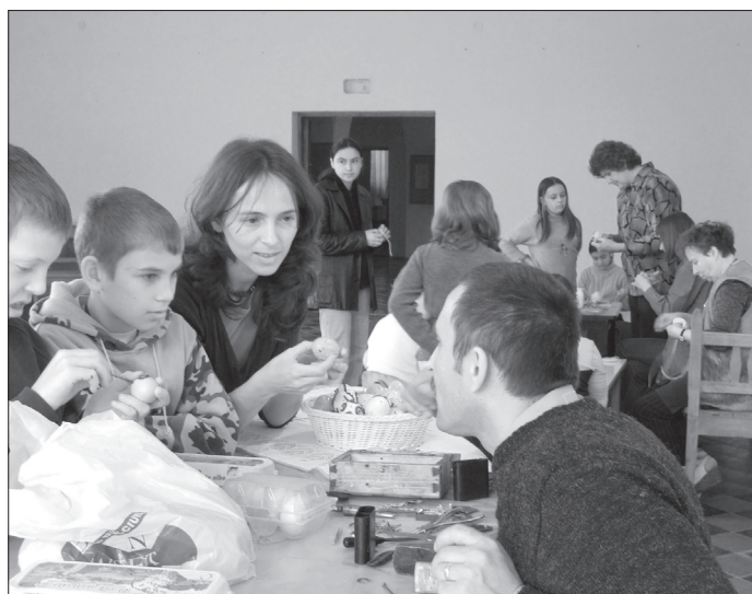
12. ábra Húsvéti foglalkozások, 2007. április 6.