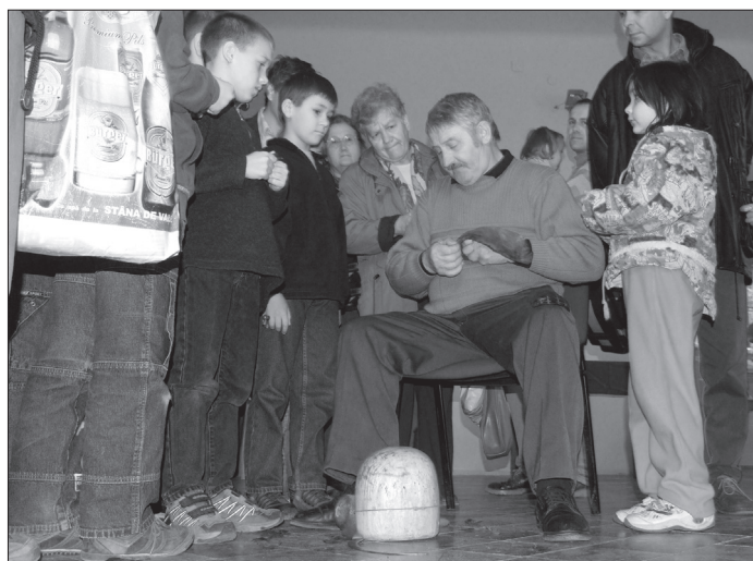
4. ábra Taplósapka készül, 2007. március 31.