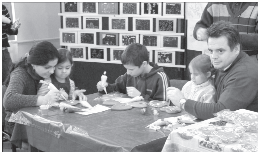
2. ábra Mézeskalács-díszítés, 2007. január 21.