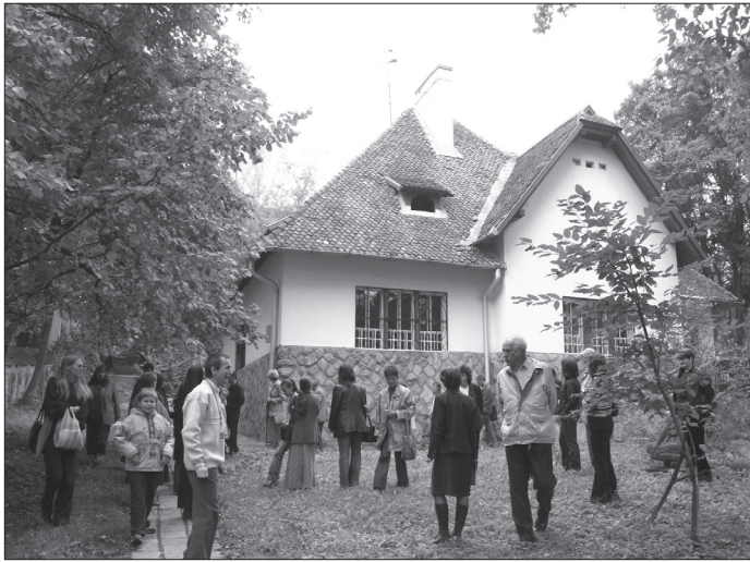
7. ábra Múzeumi séta, 2007. szeptember 15.