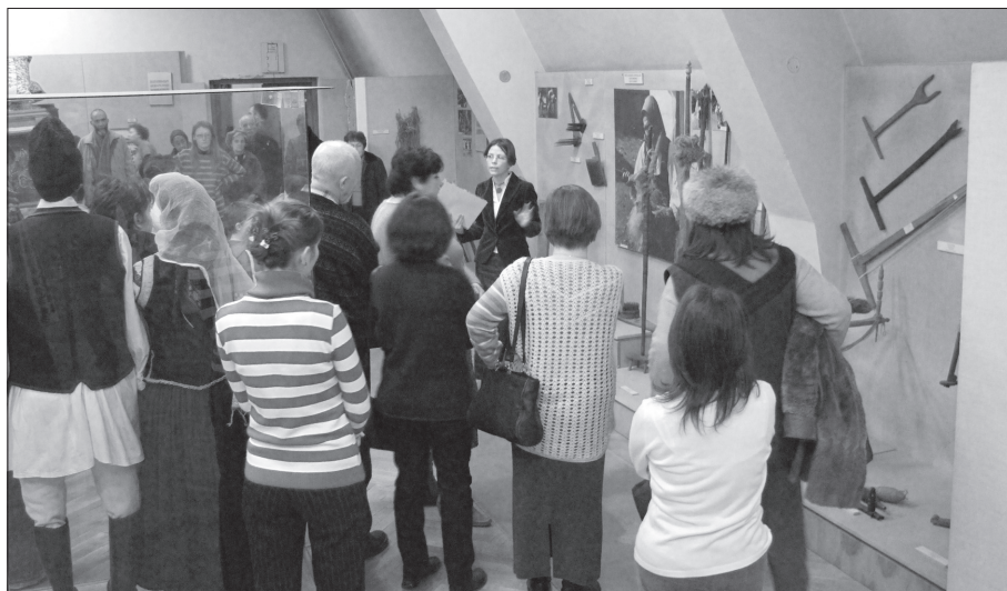
3. ábra Tárlatvezetés, 2007. január 21.