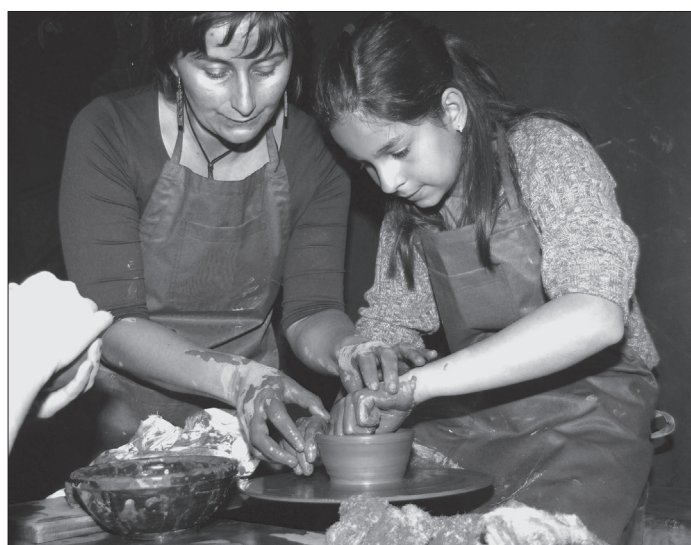
6. ábra Korongolás, 2007. május 19.