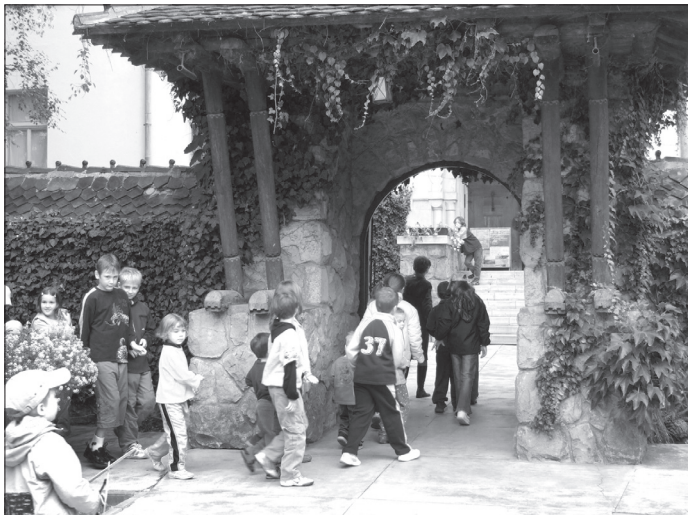
8. ábra Labirintus-játék, 2007. szeptember 15.