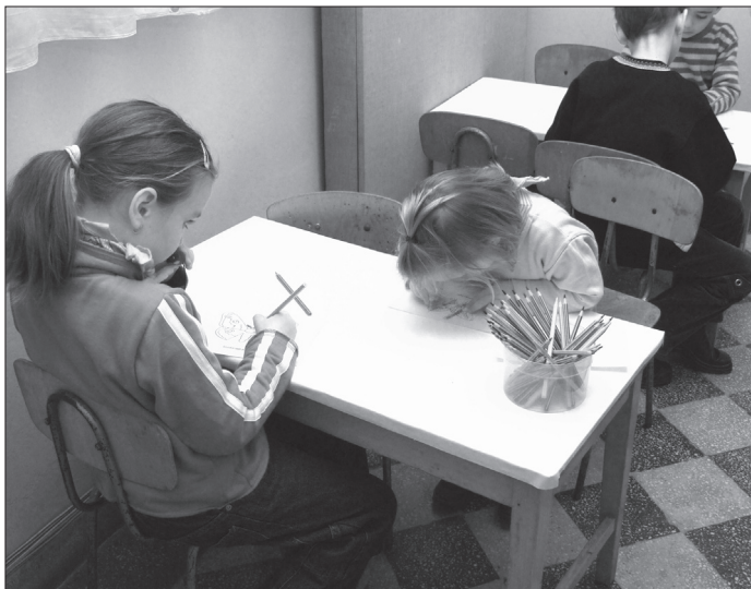
9. ábra Az élmények rajzolásra készítik a gyerekeket, 2007. március 31.