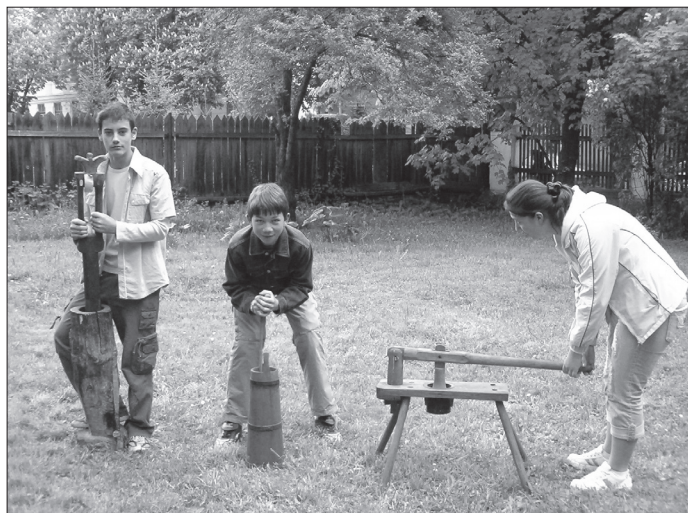
10. ábra Múzeumpedagógiai foglalkozás, 2007. május 10.