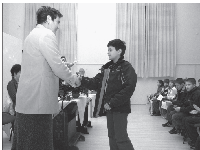
5. ábra Díjkiosztás a gombaismereti vetélkedőn, 2007. március 31.