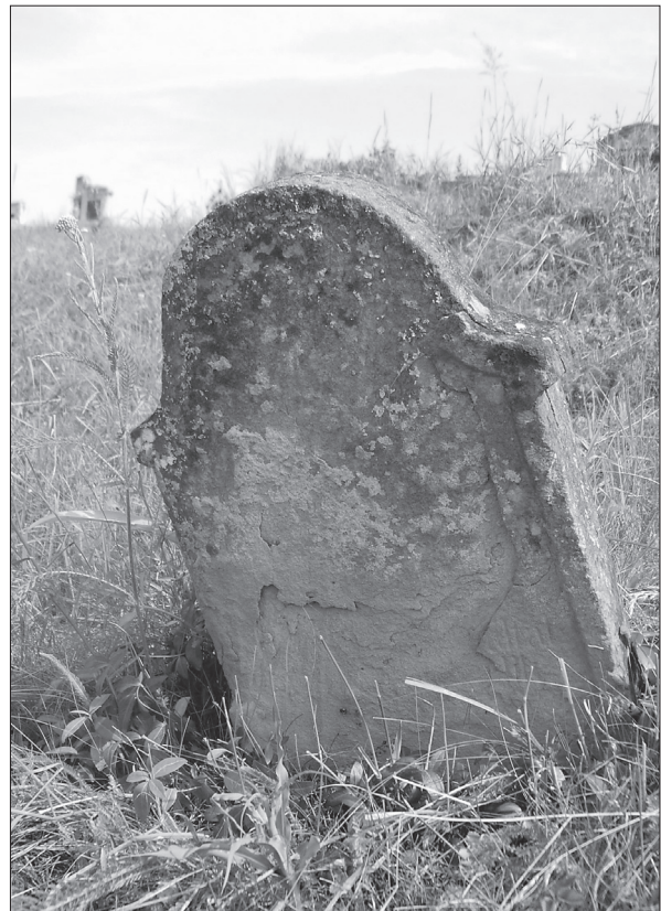
2. ábra Imre József sírköve. Fotó: Demeter Lajos, 2008.